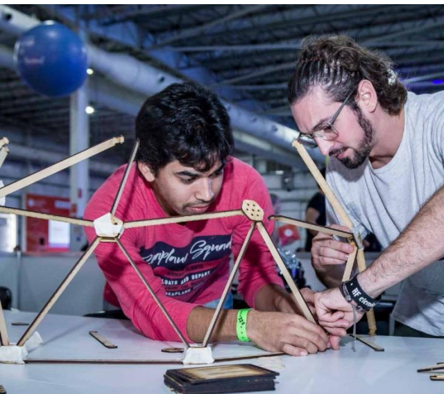
2016 · 2018 Campus Party