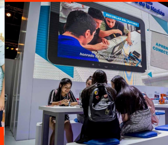
2018 · Feria del Libro