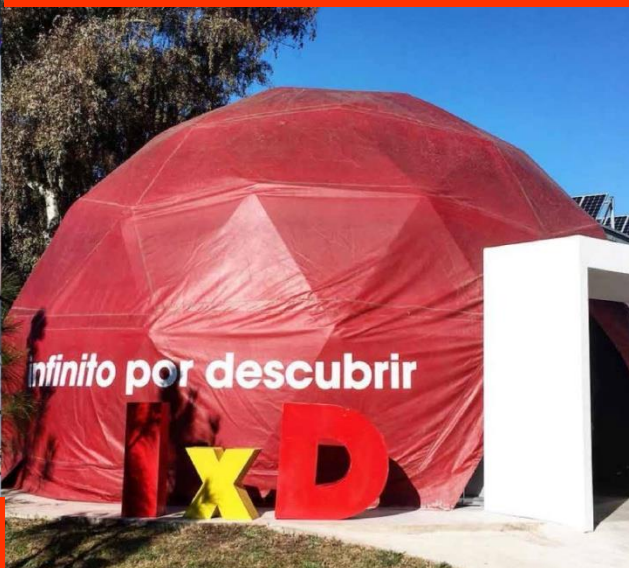
2016 · 2017 Tecnópolis