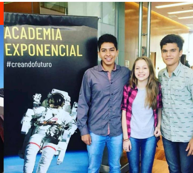
2018 · Academia exponencial