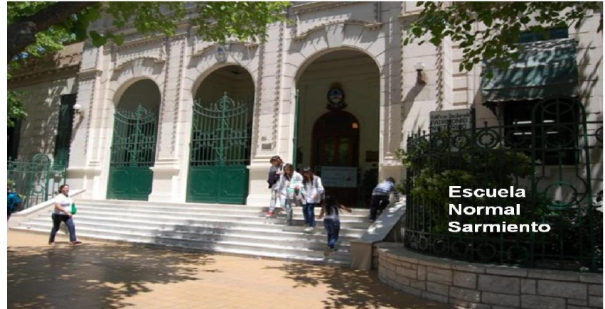
Escuela Normal Sarmiento