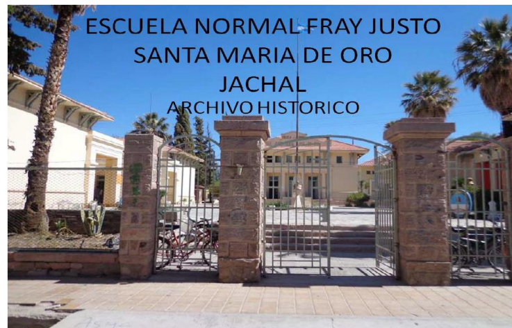
ESCUELA NORMAL FRAY JUSTO SANTA MARIA DE ORO JACHAL ARCHIVO HISTORICO