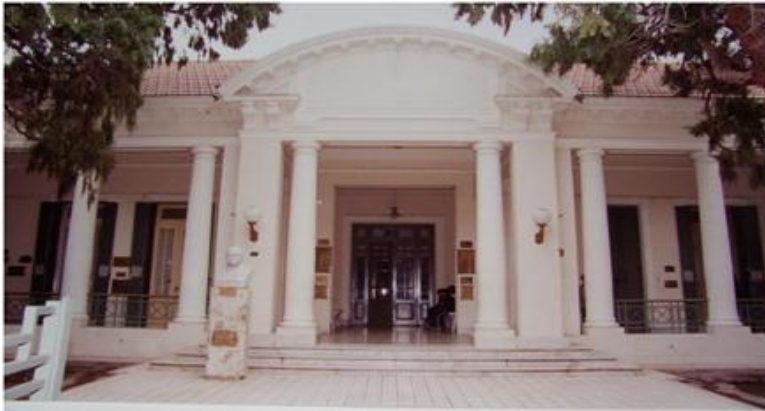
Colegio Nacional "Mons. Pablo Cabrera"