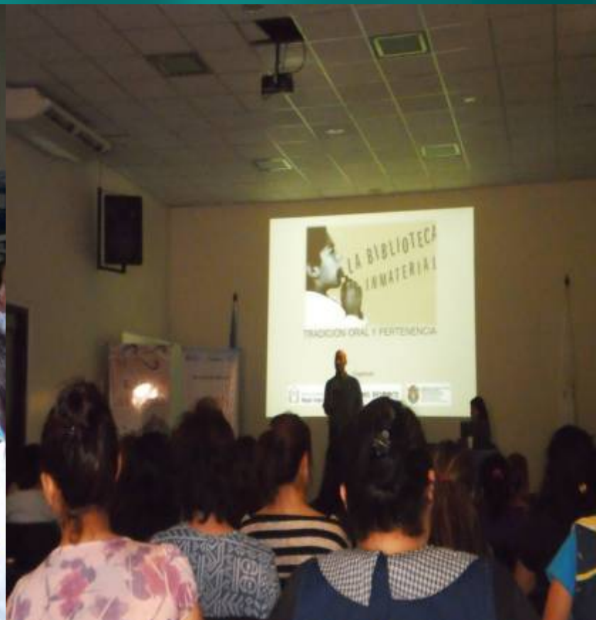
Curso Biblioteca inmaterial