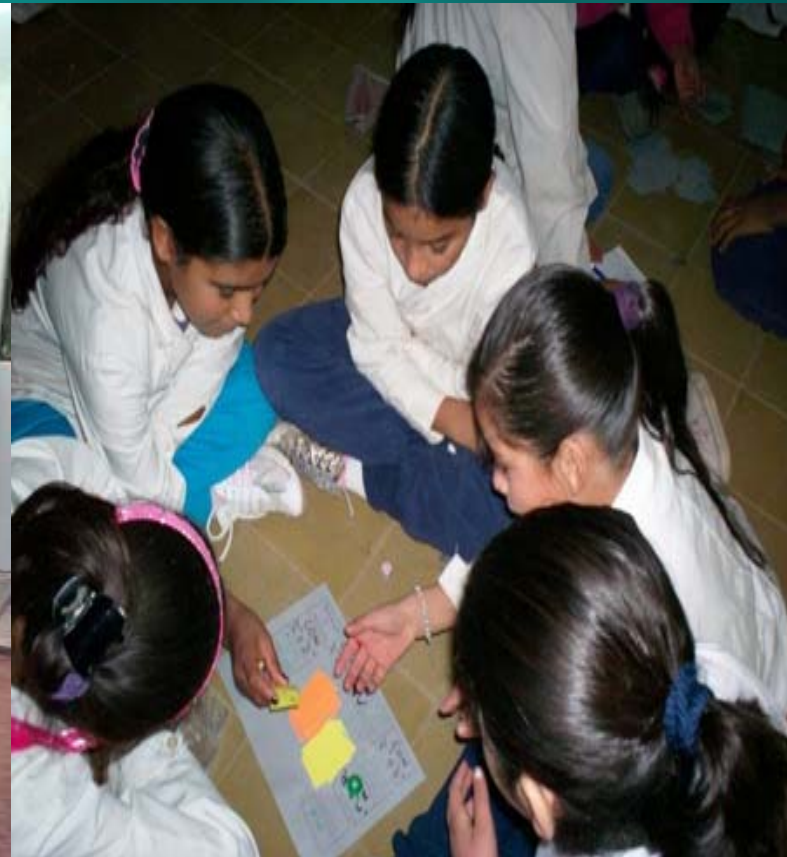
Bicicleteada y juegoteca