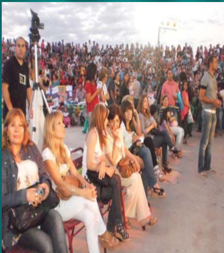
ANFITEATRO MUNICIPAL VILLA DOLORES