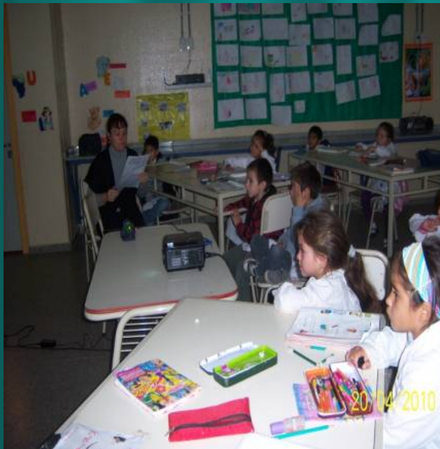
Escuela Capitán Ardiles.