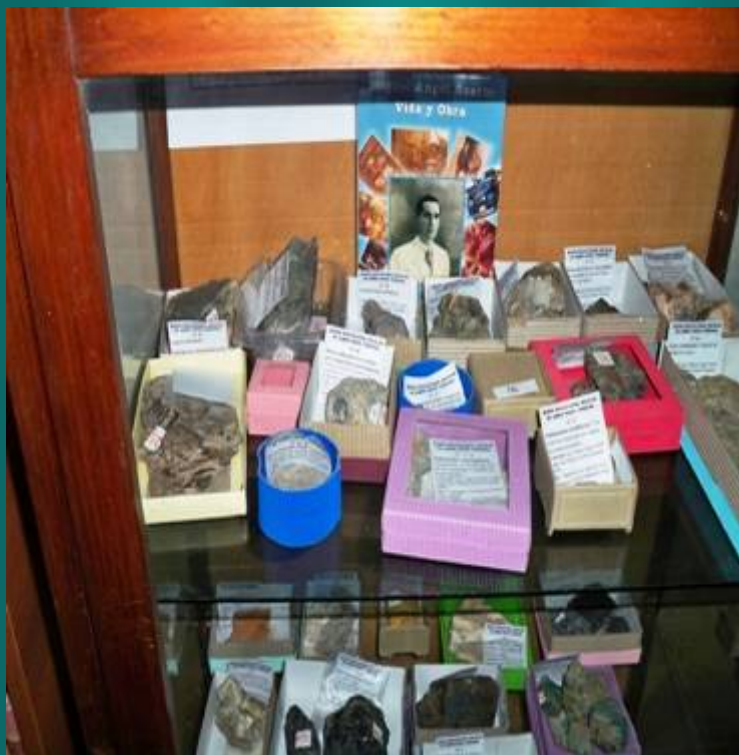
Patrimonio Arqueológico recuperado en James Craik

Los Archivos Escolares recuperan la historia de las prácticas pedagógicas, la historia de las instituciones educativas,... y la historia de nuestra cultura.