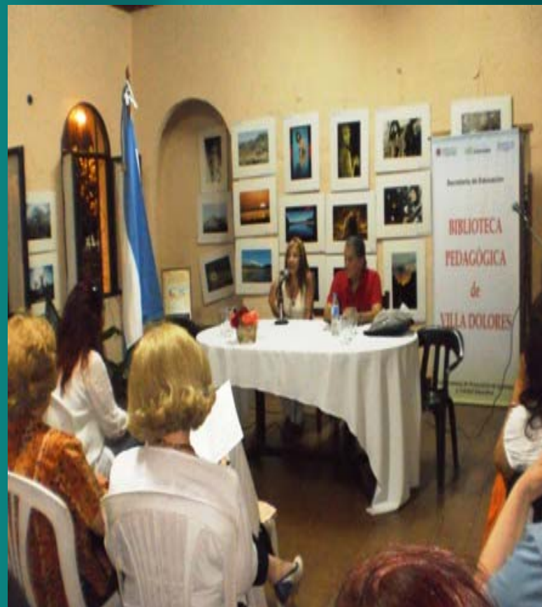
MUNICIPALIDAD DE VILLA LAS ROSAS