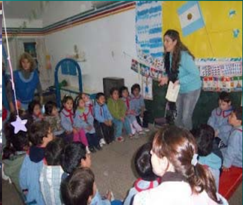
Jardín de Infantes Dr. Dalmasio Vélez Sarsfield