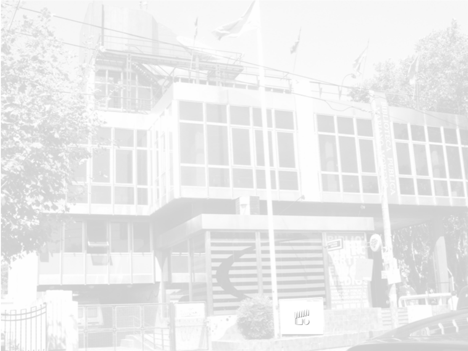
Biblioteca Pública y Complejo Cultural Mariano Moreno Jardín de Infantes Sietecolores