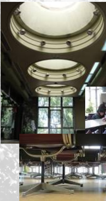
Sala de lectura silenciosa