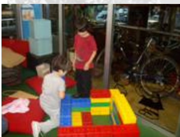
Sala de actividades