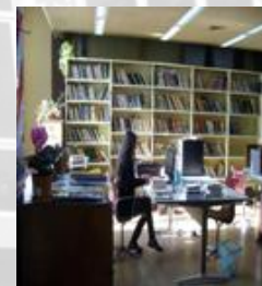
Biblioteca Nacional de Maestros

Fundada en 1932, declarada de interés público nacional, provincial y municipal; hoy cuenta con más de 60.000 volúmenes para préstamo y otros miles para consulta en Sala catalogados en Winisis además de miles de videos.