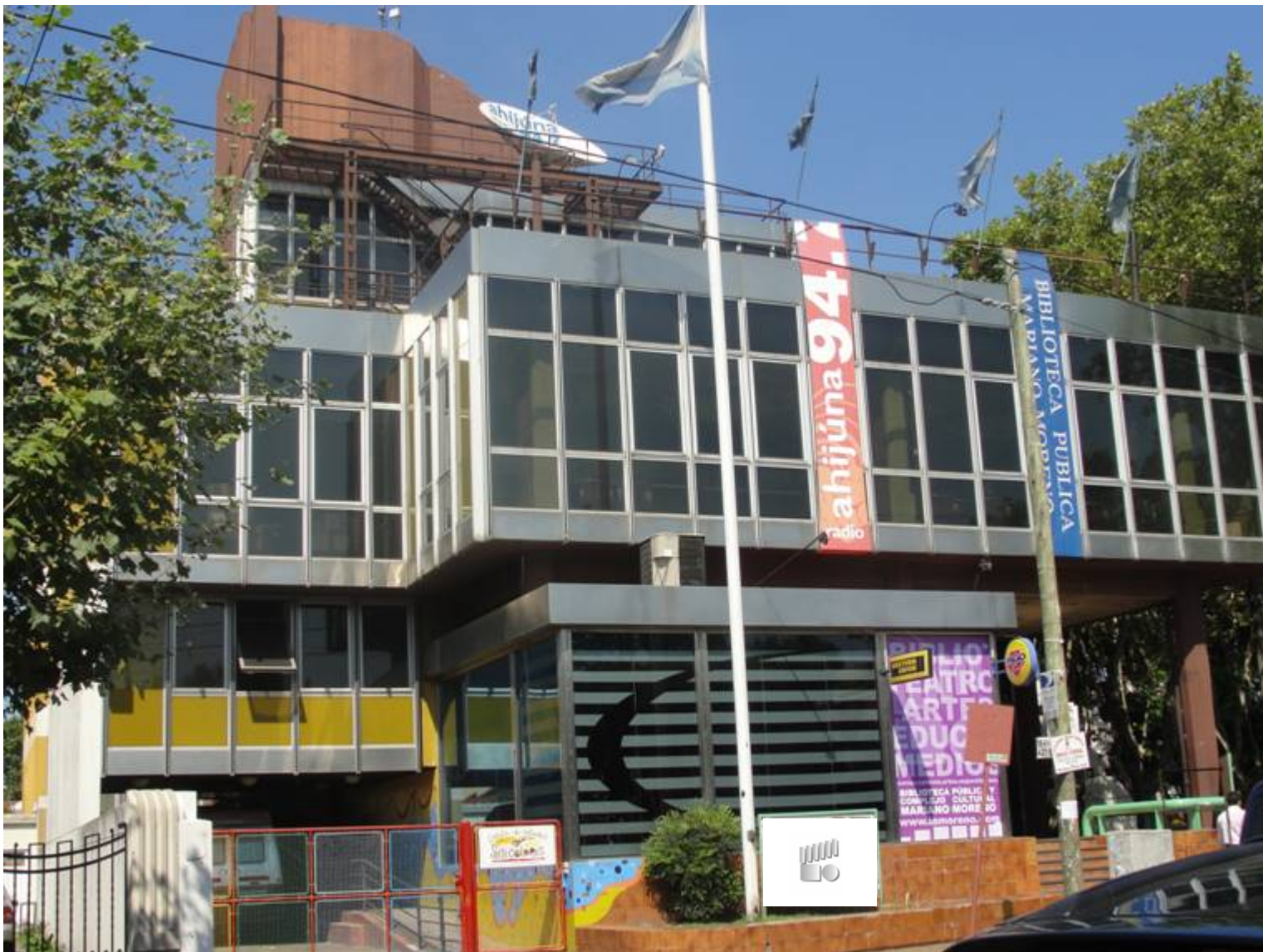
Biblioteca Pública y Complejo Cultural Mariano Moreno Jardín de Infantes Sietecolores