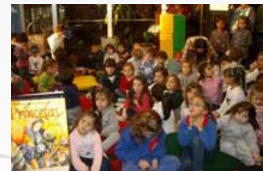
La Hora del Cuento