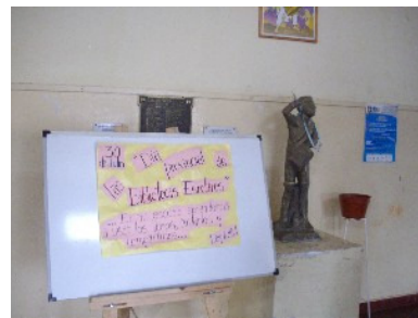
Equipo docente y del Programa BERA de La Rioja junto al afiche de difusión del Día provincial de las bibliotecas escolares