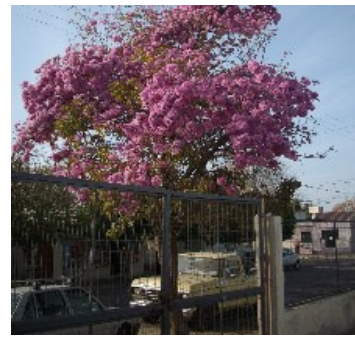
Ingreso a la escuela