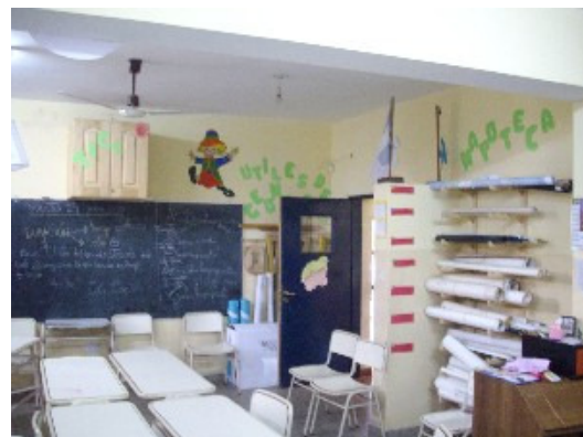
El rincón de lectura

Visite esta escuela en el Mapa Educativo