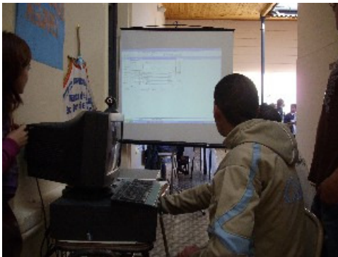
Apropiación de las funciones de Aguapey

Esta institución presentó en la muestra un trabajo realizado por los estudiantes de tercero polimodal a partir de una propuesta del docente de programación informática. Con la idea de innovar en Aguapey, han desarrollado un programa basado en Visual Basic que les permite generar carnets con códigos de barra para los usuarios de la biblioteca. Mediante la utilización de una webcam, esta aplicación toma una fotografía del titular del carnet que se imprime junto con sus datos personales.