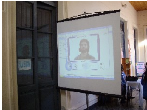
Fotografía mediante Webcam

Esta institución presentó en la muestra un trabajo realizado por los estudiantes de tercero polimodal a partir de una propuesta del docente de programación informática. Con la idea de innovar en Aguapey, han desarrollado un programa basado en Visual Basic que les permite generar carnets con códigos de barra para los usuarios de la biblioteca. Mediante la utilización de una webcam, esta aplicación toma una fotografía del titular del carnet que se imprime junto con sus datos personales.