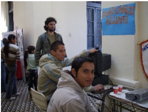
Primeros carnets de usuario en Aguapey