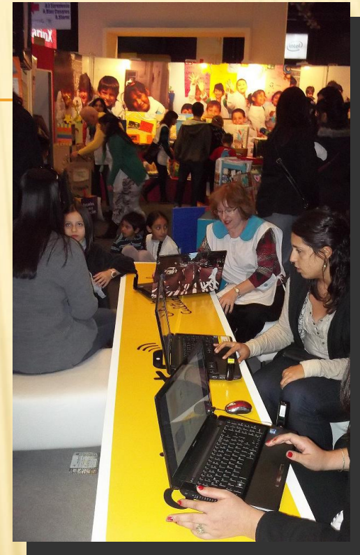
Stand del Ministerio de Educación C.A.B.A.