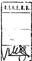
JULIO PAUL HAJNERI MINISTRO DE EDUCACION Y JUSTICIA

ARTICULO 3º.- Regístrese, comuníquese y pase a la DIRECCION NACIONAL DE EDUCACION MEDIA para su cumplimiento.