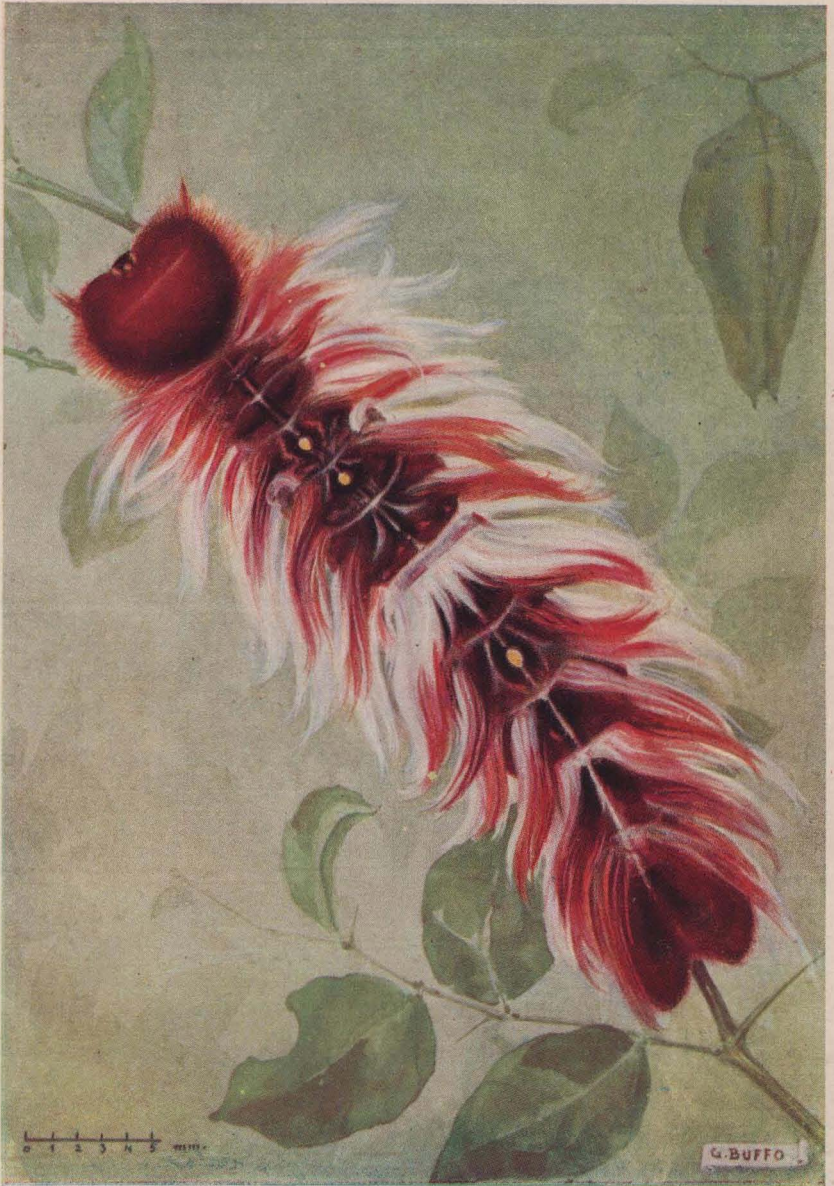
Oruga de Morpho Catenarius.