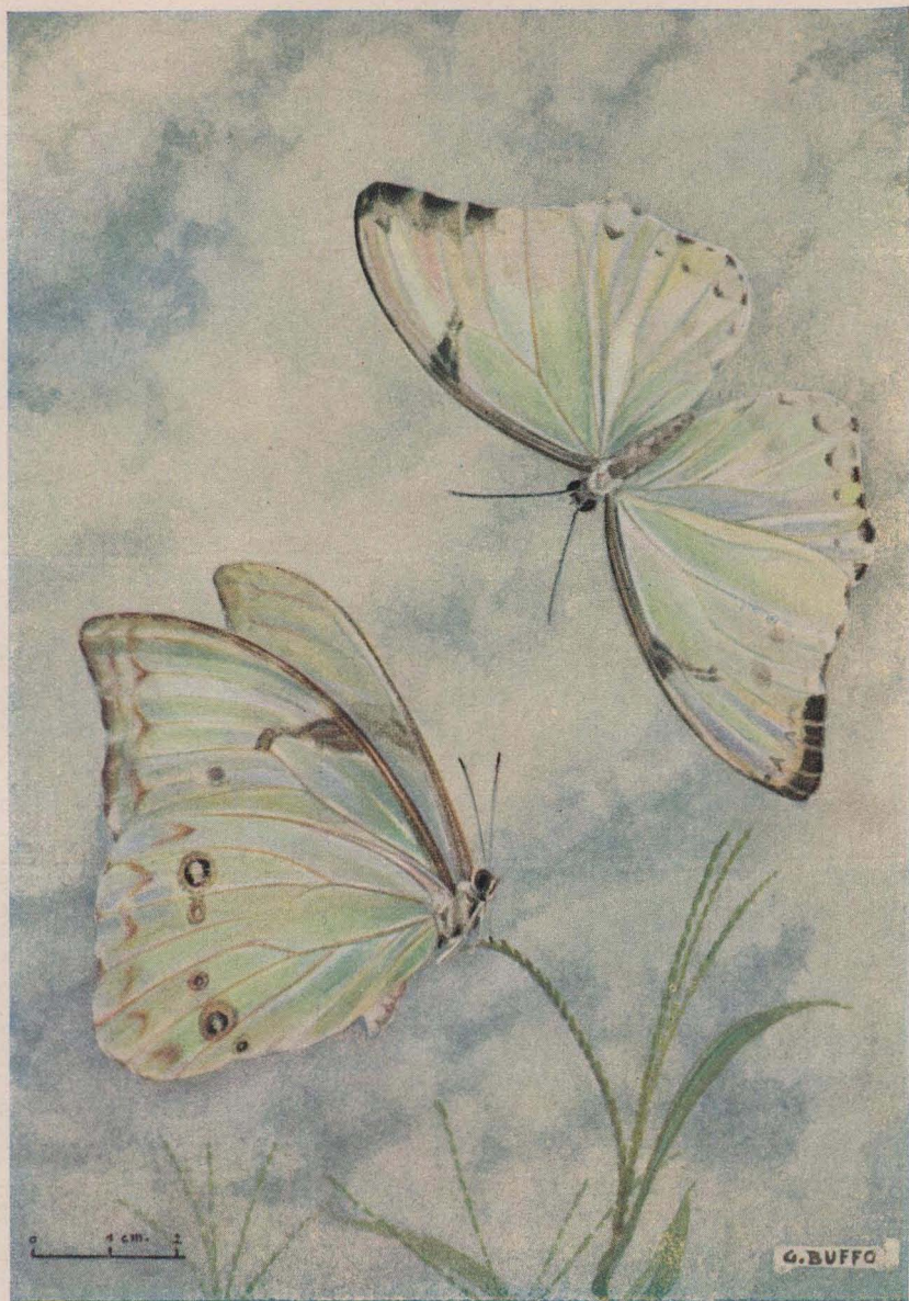
Mariposa de Morpho Catenarius