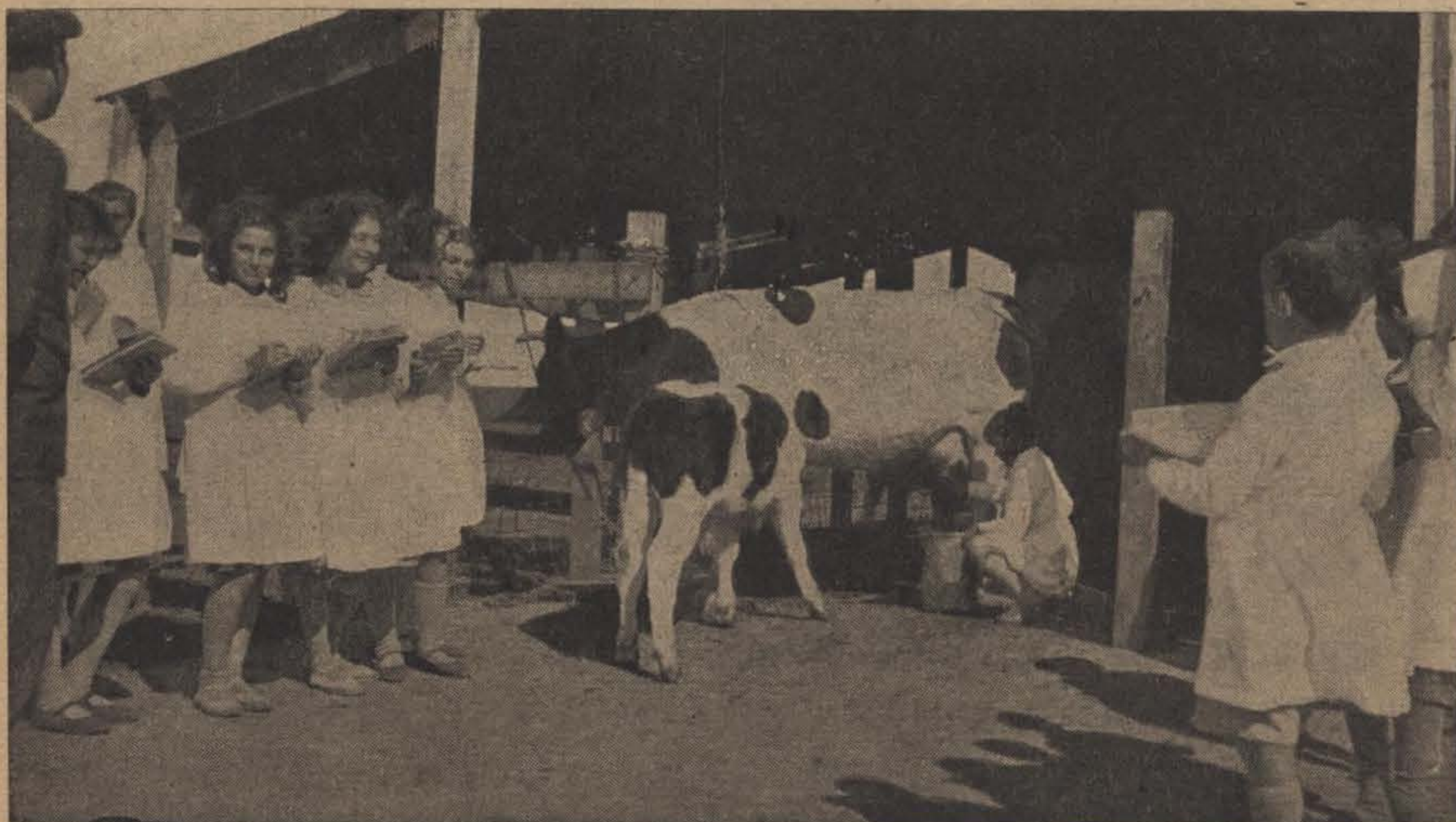
En el tambo, los alumnos presencian y practican el ordeño

de la tierra todo lo que pueda dar, cuando se independice al futuro hombre de campo de los amagos de las malas cosechas, cuando la chacra