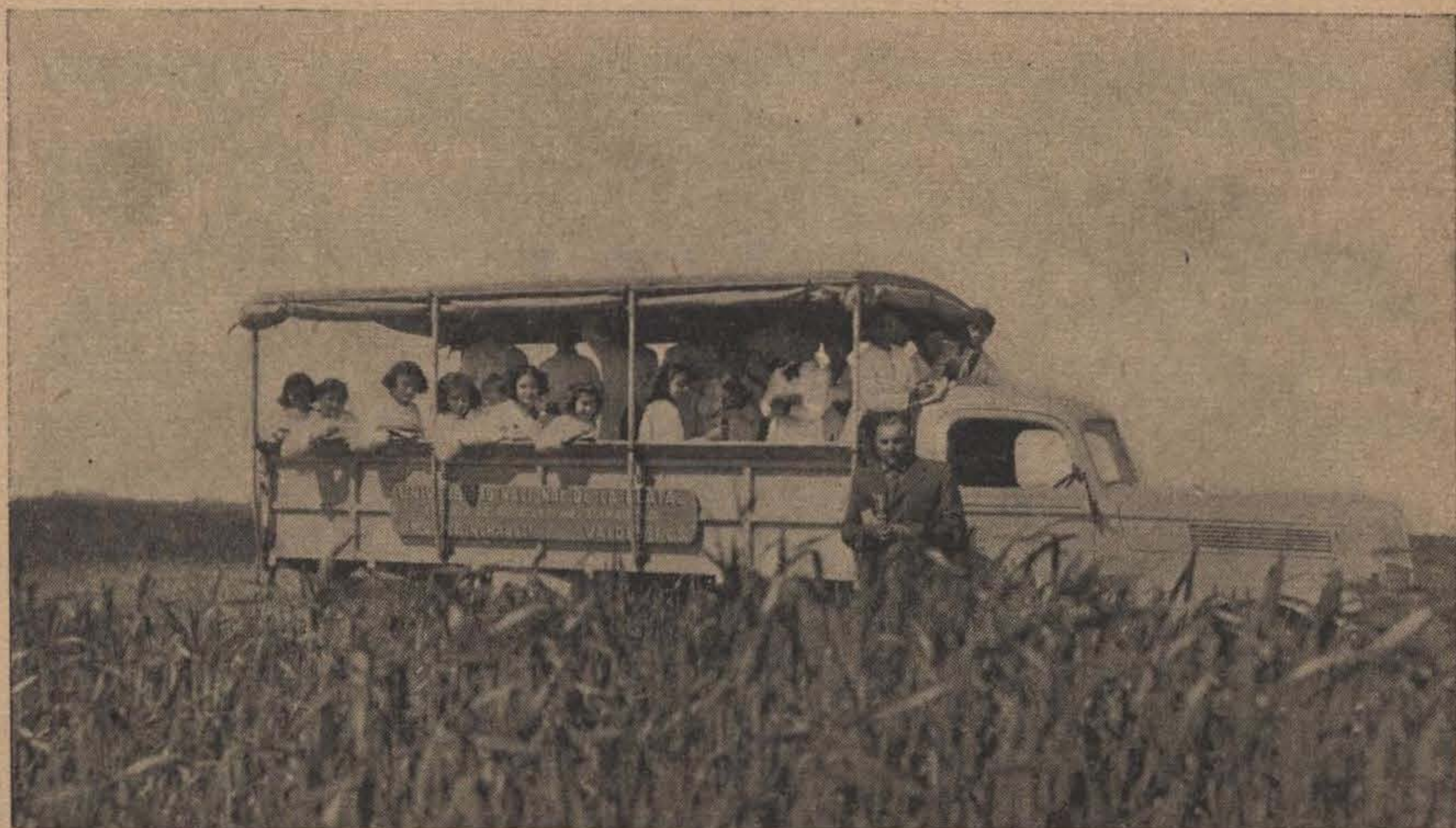
En el camión de la Escuela de Agricultura y Ganadería llegan los niños al campo experimental de cereales

No debe omitirse ningún esfuerzo en hacer sentir al niño el cariño por la tierra; en procurar, en toda forma, que no lo deslumbre la ciu-