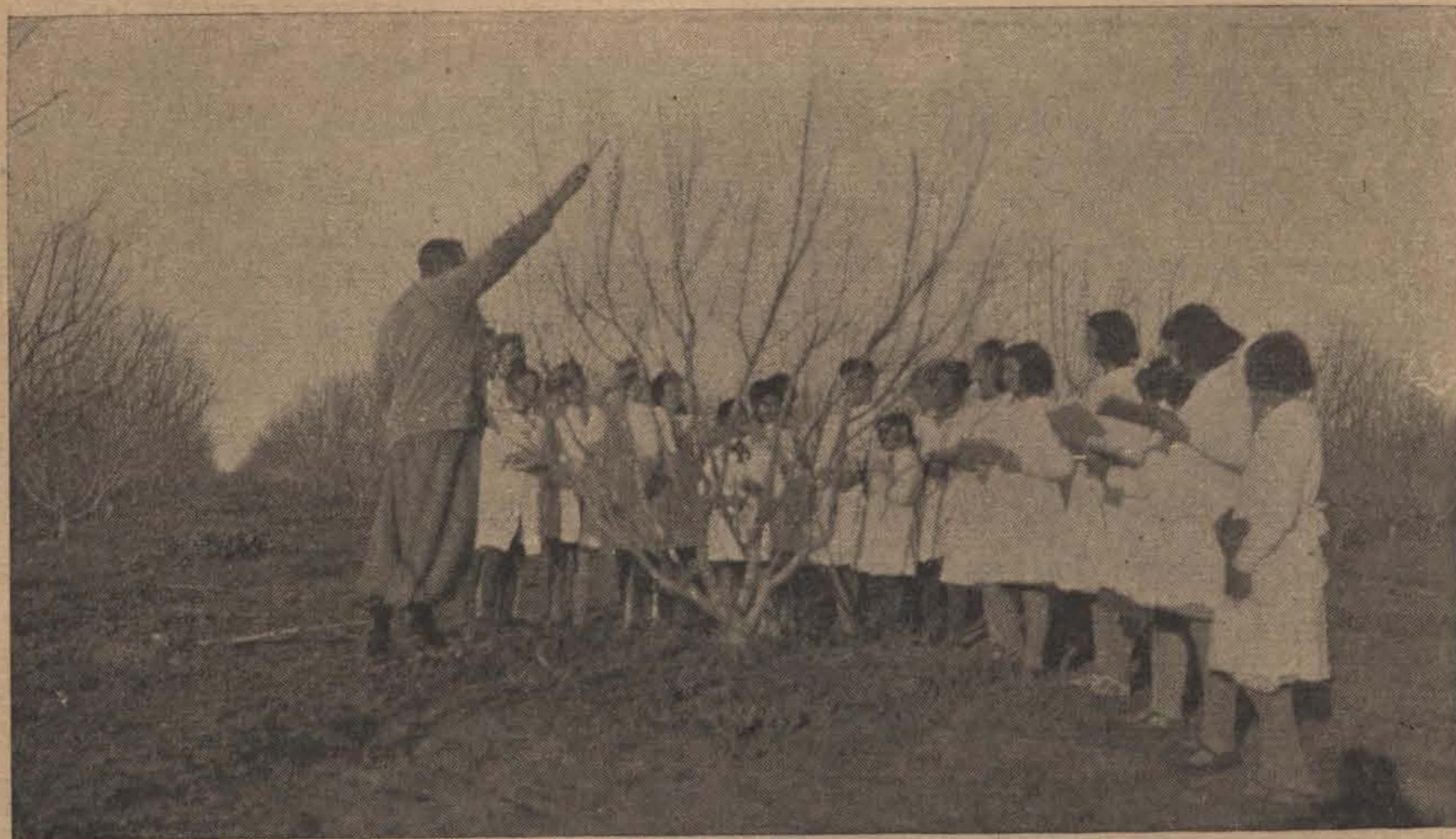
Enseñanza de la poda de frutales

Cuando con la aplicación de los conocimientos adquiridos, realizados con el desenvolvimiento de la chacra mixta , sea factible obtener