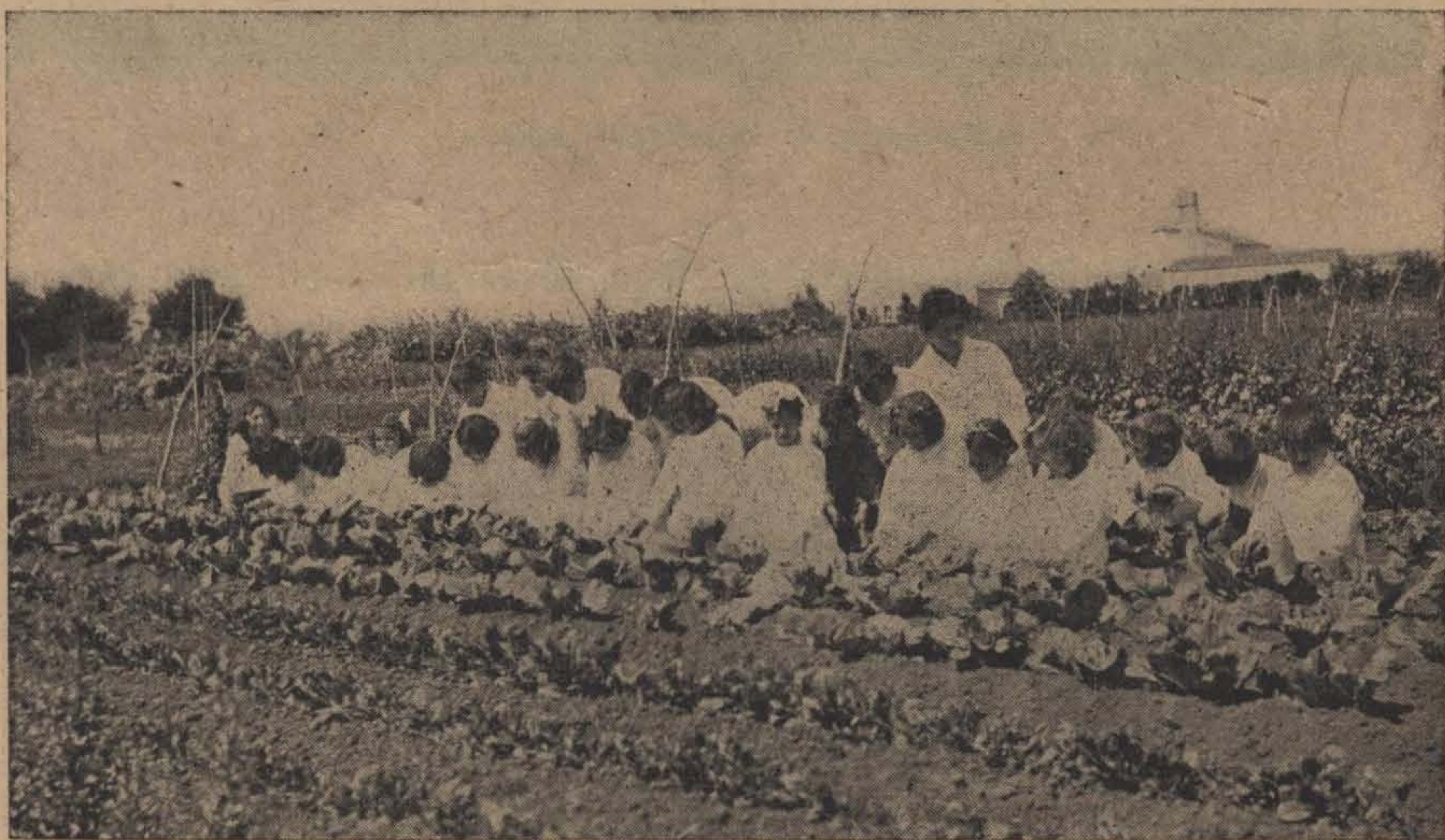
En la huerta escolar

En estas escuelas, son raros los niños que cursan los grados superiores, ya porque su escaso número no permite la creación de estos grados o porque los padres los retiran tempranamente de la escuela para utilizarlos en sus trabajos rurales.