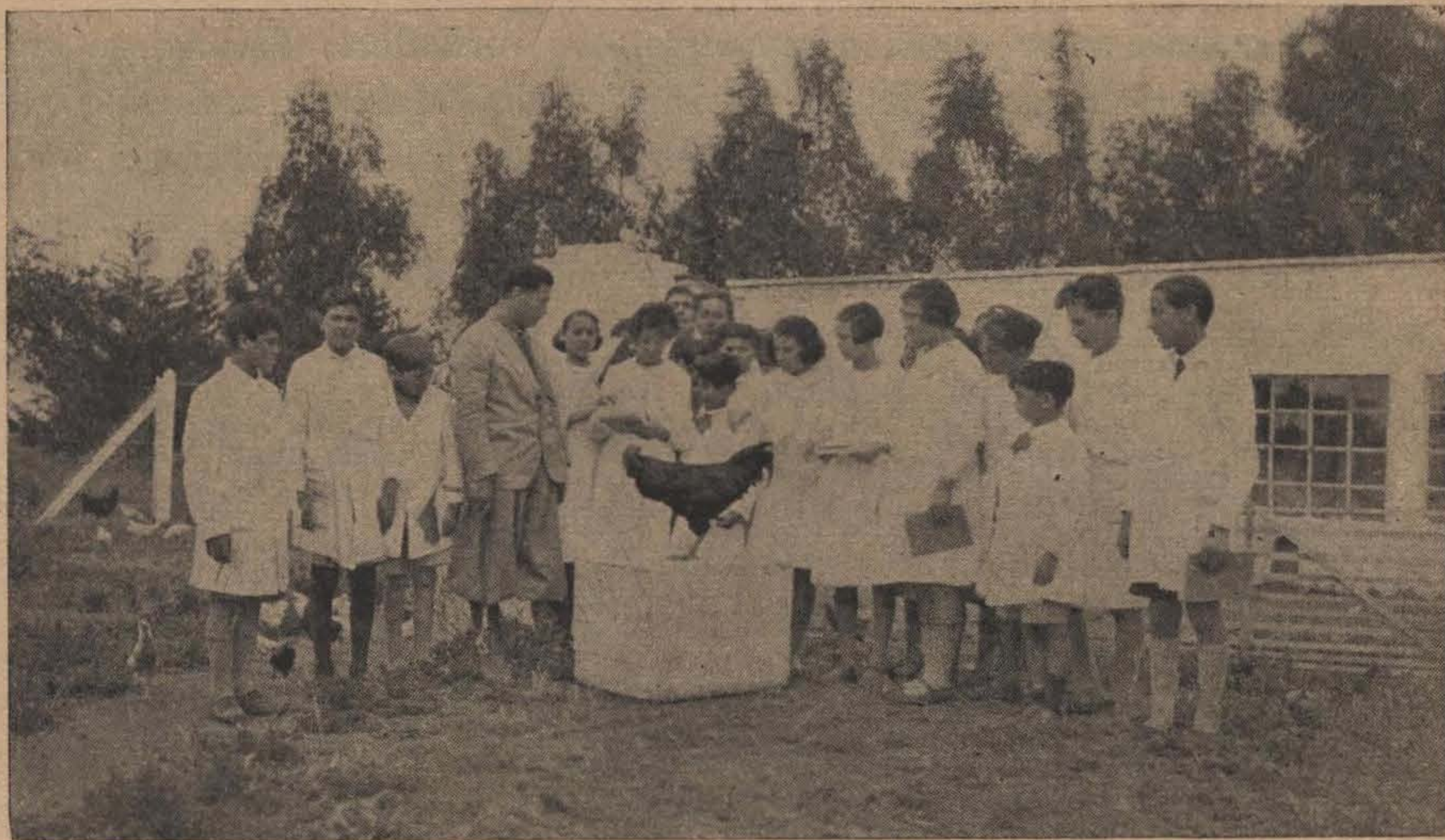
Explicando las características de las aves de raza

mixta argentina actúe cual regulador benéfico de la monocultura y de los excesos unilaterales de la producción, sólo entonces se amará de verdad el campo y la gente se verá inclinada a sus múltiples y nobles tareas.