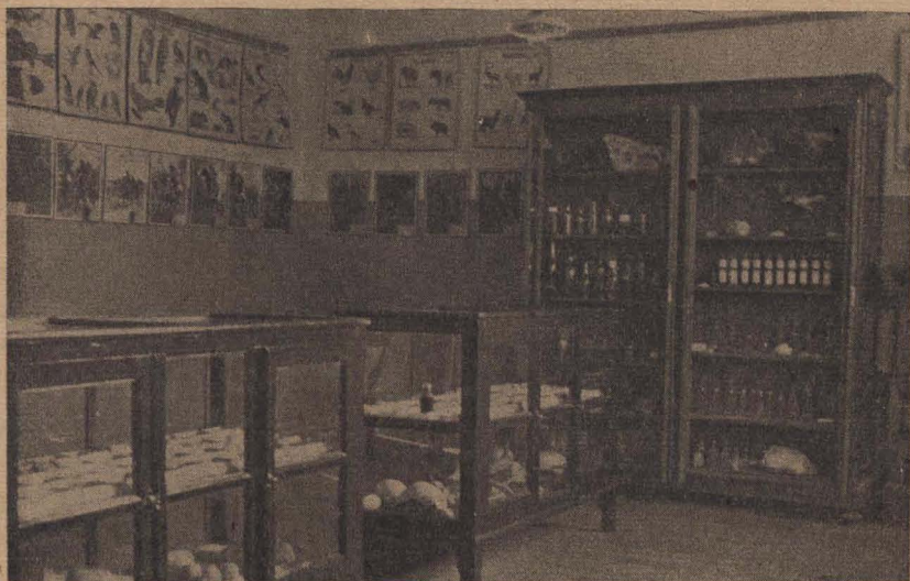
Una sección del museo de la escuela

Como números de verdadera atracción figuraban esos concursos en las Fiestas del Sábado. Otras veces se practicaban en horas de clase reuniendo al efecto todos los grados o solamente los de un turno, siempre con visible éxito emotivo, lo que por sí sólo es suficiente, porque en donde hay emoción, hay educación.