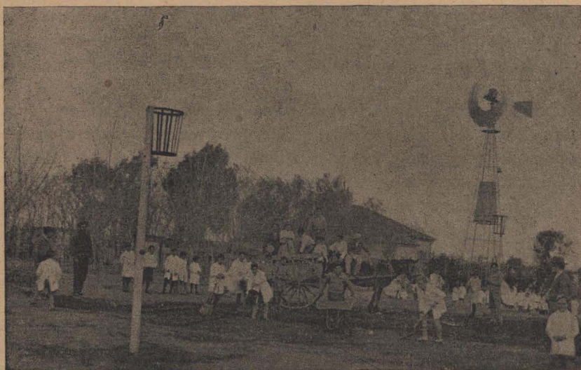
Alumnos preparando el terreno de juegos

El nombre de “E. F. I. M. Club”, (Club de Educación Física, Intelectual y Moral), es sólo una fórmula, que podría ser otra. Lo impor-