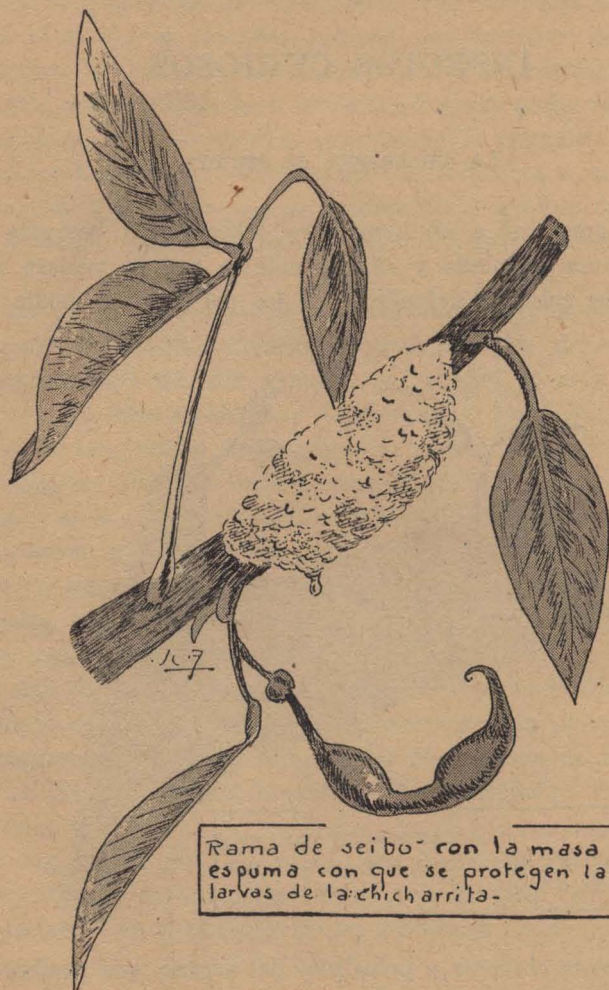
Rama de seibo con la masa de espuma con que se protegen las larvas de la chicharra.

glotonería, absorben sin descanso la savia y expelen los desechos transformados en una espuma semejante a la de jabón, que las envuelven por completo. Sin esa protección las débiles larvas estarían expuestas a la desecación por el calor del sol y a los ataques de las aves insectívoras.