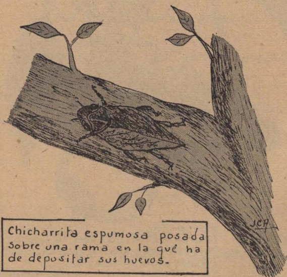
Chicharrita espumosa posada sobre una rama en la que ha de depositar sus huevos.

Denominamos así a un homóptero (chicharras) bastante común en nuestra zona templada y cálida, notable por la manera original que tienen sus crías de defenderse de los peligros del medio en que evolucionan.