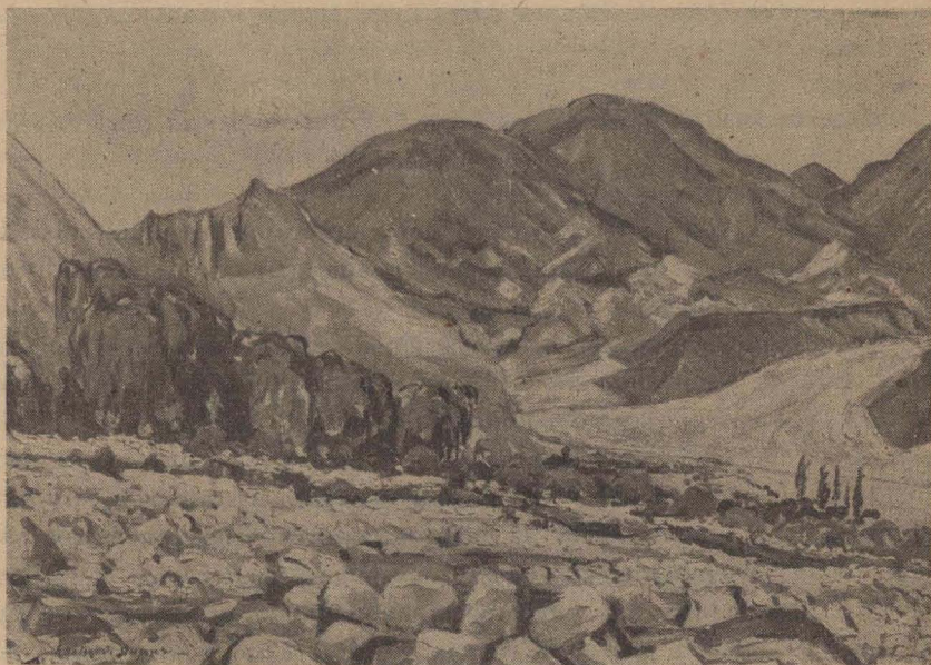
CAUCE DEL RIO HUASAMAYO, EN TILCARA (Oleo de Eloisa J. Dufour)

siéntese inflamarse el pecho de sublime emoción, cuando el turista aun en el tren, abandonando su camarote con el primer vislumbre matutino, contempla la inmensa y tupida fronda que envuelve a la capital de Jujuy como manto esmeraldino, que oculta a los ojos del viajero la hermosa ciudad y con igual intensidad de sorpresa, se comprueba a poco que Jujuy es una provincia limpia; que da la sensación de disciplina y orden; no de tristeza ni de pobreza.