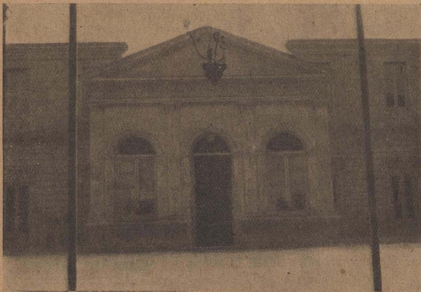
La sala de cirugía y autopsia de la vieja Facultad de Medicina transformada en salón de música y de trabajos manuales de la Escuela Rawson