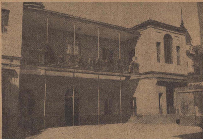
Costado norte del cuerpo anterior del edificio antiguo fotografiado desde el patio de recreo

ubicación en la calle Córdoba y el viejo Convento de Betlemitas volvió a cambiar de dueño, siendo adquirido en 1886 por el Consejo Nacional de Educación en la suma de cincuenta mil nacionales, que fueron abonados en cuotas mensuales de a cinco mil, a partir del primero de mayo de ese mismo año, más un suplemento de diez mil pesos que se resolvió agregar al poco tiempo accediendo a las gestiones de la Facultad citada, y teniendo en cuenta que el local podía ser habilitado para que funcionase en él una escuela bastante concurrida.