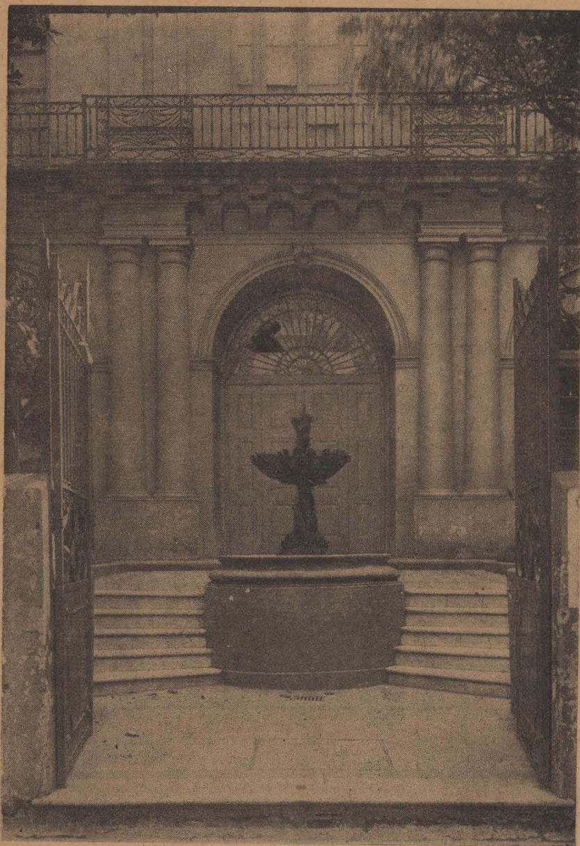
Entrada de la vieja Escuela Rawson con la verja y puerta de hierro, la escalinata y la fuente donada por los estudiantes uruguayos a la Facultad de Medicina porteña