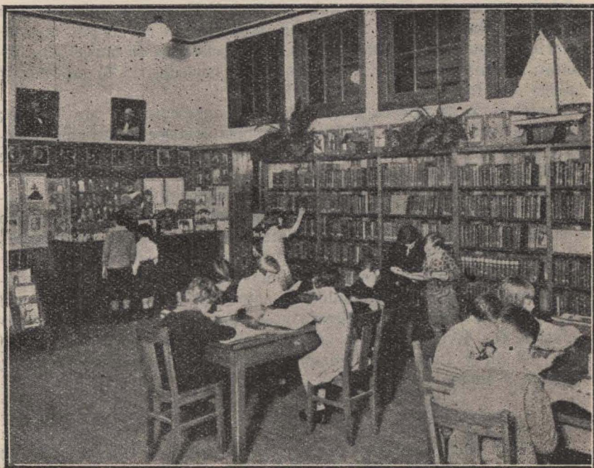
Biblioteca de una Escuela "Platoon"

Como solamente una persona está encargada de la mayoría de las clases, se puede llevar a cabo un definido programa de higiene y juego. Todo niño aprende un grupo determinado de juegos y otros que se espera continuará practicando en el futuro. El programa de juegos interesa al niño y le ayuda en su desarrollo.