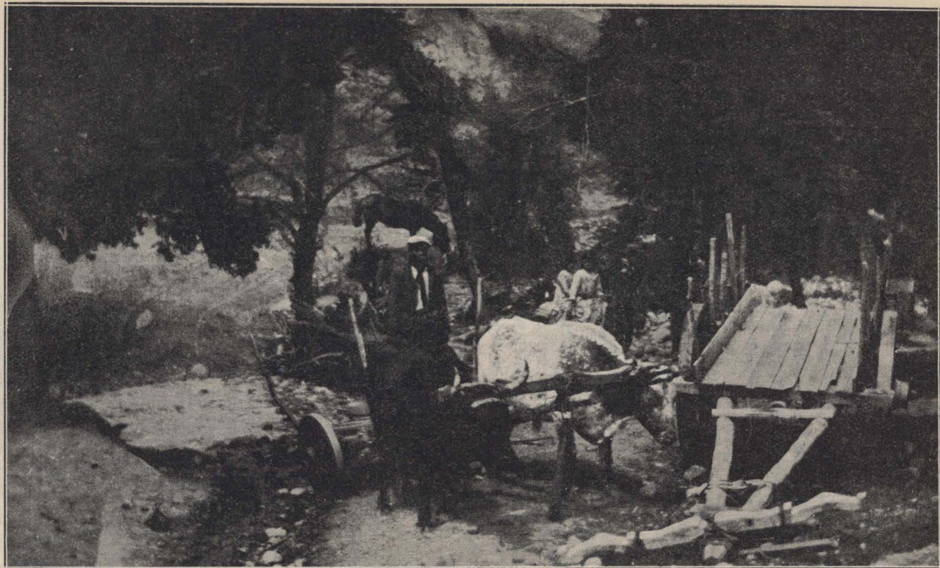
BELLEZAS ARGENTINAS. — Catango rodeando un afluente del Epuyen. — Detrás del cerro están las minas de carbón