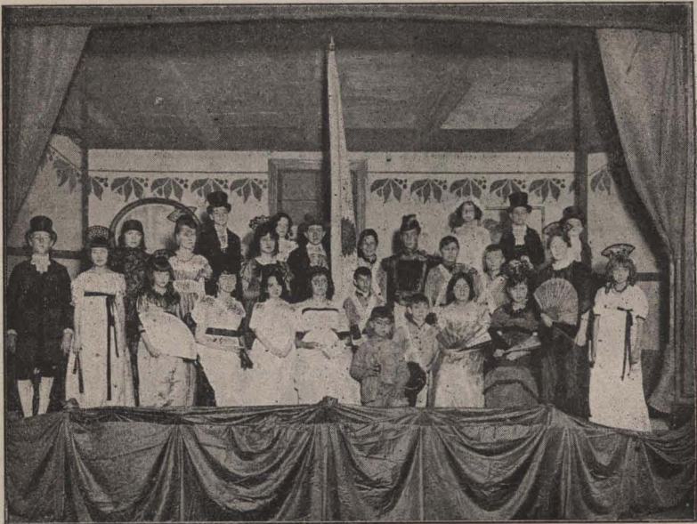
Alumnos que representaron esta comedia en el Colegio Germania

Doña Clara .—¡Nada tiene que agradecer, señor comandante! ¡Nosotras somos y seremos siempre las agradecidas, pues jamás, sin vuestro concur-