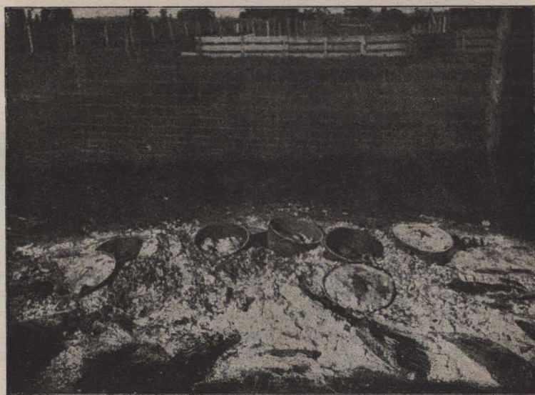
Después de la cocción

golpeados con un lápiz, por ejemplo, y podrán contener agua si la arcilla empleada es arcilla de temperatura baja. Los platos y vasos hechos en la escuela deberían ser preservados por el fuego en razón de que así se muestra a los niños un proceso industrial y porque una vez cocidos esos objetos pueden