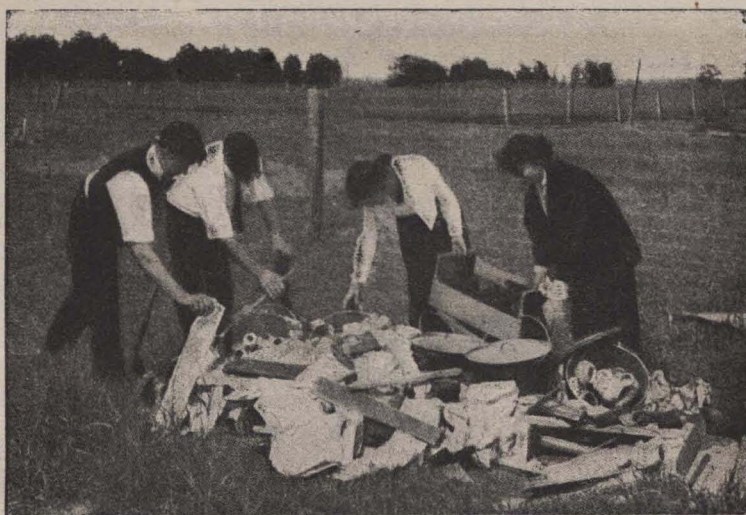
Alumnos preparando un horno rudimentario para cocer cerámica

Para el cocimiento de la cerámica no es necesario disponer de un horno a fin de conseguir productos excelentes, a no ser que se desee vidriar los trabajos. Los objetos cocidos en fuego abierto darán un sonido sonoro al ser