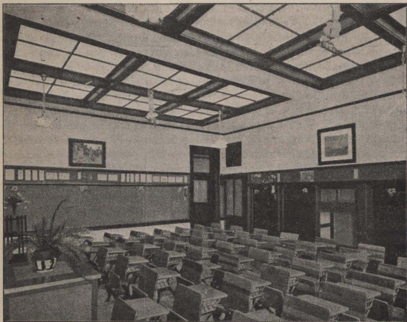
Nueva disposición de luz para las aulas

ma de su iluminación con luz solar. «La primera sensación que uno recibe al entrar en él, dice un visitante, es la de ser aquel personaje novelesco que perdió su sombra, con el agregado de que toda cosa o cuerpo existente en el aula carece también de sombra. La luz llega primero de claraboyas de un tejado abierto y con bordes dentados, pasa luego por un cielo-raso de vidrio y es casi perfectamente difusa. Los pizarrones, los cuadros en las paredes, los bancos y hasta el suelo, parecen como rodeados de una luz difusa que