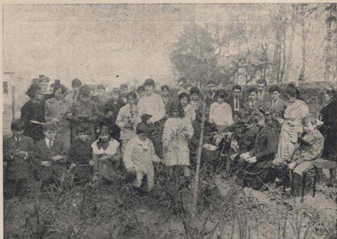
Cuarto grado A. — Estudiando plantas

materias, particularmente la de las ciencias naturales, que, a parte de la dotación material de la escuela, puede tener intere-