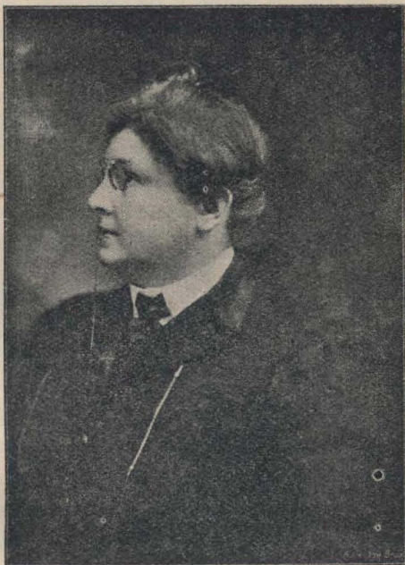
Doctora I. Ioteyko.

no sabían adonde acudir. Habían tratado de seguir aquí y allá, algunos cursos aislados; pero se habían decepcionado, no encontrando en ninguna parte cursos organizados que se encadenasen mutuamente y fueran capaces de proporcionar conocimientos paidológicos completos. Esto era exacto, principalmente para los países de lengua francesa, pues en Alemania existían ya en muchos lugares, cursos destinados a la enseñanza de la paidología. Con todo, no tenían el sello universitario que consideramos como indispensable. Un instituto consagrado a las ciencias psicológicas y paidológicas, no debe ser la continuación de la escuela primaria, no debe ser tampoco, la extensión de la universidad. Debe ser la universidad misma. Y, de igual modo que existen escuelas superiores que poseen rango de Facultad, pero independientes de la universidad propiamente dicha (como la Escuela Politécnica, la Escuela Central, la Escuela de Minas, etc.), nuestra Facultad será, ella también, un centro autónomo consagrado a los altos estudios paidológicos y pedagógicos.