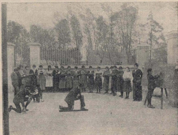
Cuarto grado D. — En clase de Geometría

de fotografías referentes a ese establecimiento. Demuestran la forma práctica en que se desarrolla la enseñanza de las diversas