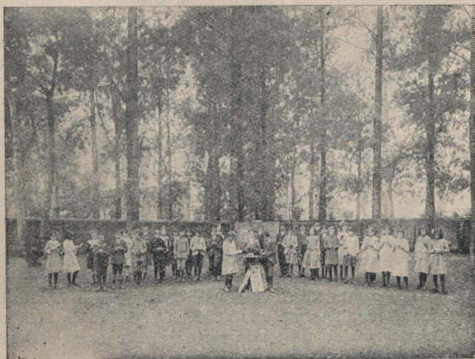
Tercer grado. — Estudiando el fruto

La Dirección de la Escuela Elemental Nacional N.º 56, de San Nicolás, (Pcia. de Buenos Aires), nos ha remitido una serie