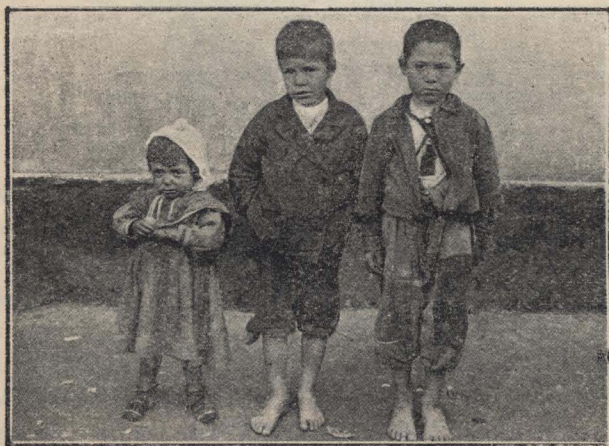
Niños menesterosos del S. O. de la Capital.

lidez de la mayoría de sus ocupantes, que indudablemente nada aprenden presas del sopor del hambre, y que, sin embargo, la estadística cuenta como escolares y futuros ciudadanos eficientes, y