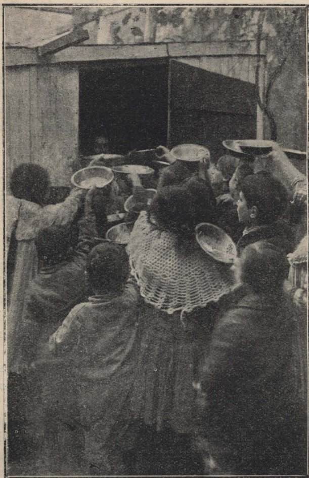
Distribución de sopa en la calle Santa María 483.

en 1896, se ha propagado en muchas ciudades: Milán gastó, en 1909, más de cuatrocientas mil liras, es decir, casi el doble de lo que el presupuesto vigente destina a este servicio en la Capital, cuya población es casi tres veces mayor. Noruega, alimentó en 1908, seis mil niños. En Estados Unidos, donde el movimiento empezó hace medio siglo, centenares de miles de niños pobres lo aprovechan en más de treinta grandes ciudades, donde miles de personas se han dedicado a este servicio social. En Inglaterra,