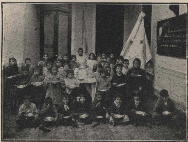
Asociación "La Obra de la Patria".

Esa tarde nació la escuela nueva—la que asocia la acción al pensamiento y que hoy ha servido de base para la reorganización de las escuelas nocturnas. El pequeñuelo que un día llegó