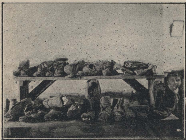
Calzado usado por niños menesterosos.

Este fin es necesario. Si el Estado obliga al niño a concurrir a la escuela, el niño tiene derecho a que el Estado lo alimente, cuando sus padres no están en situación de hacerlo. Alimentar a todo niño que sufra de hambre es, sin duda alguna, un deber ineludible de la Nación, pues si no ha alcanzado la edad escolar, requiere ser alimentado para que la alcance.