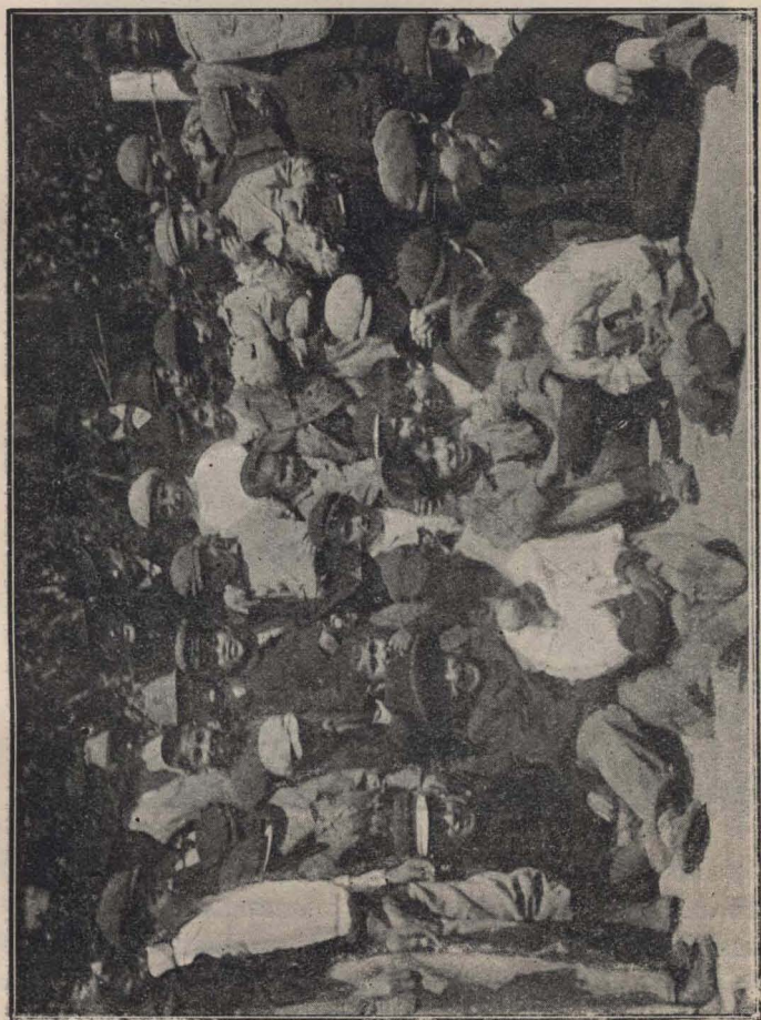
Escuela Moreno. — Aguardando la sopa.

en 1902, el Conde de Beauchamp, dijo: «los niños de un país son su capital y es por el uso y valor de su capital que se puede apreciar la sabiduría de una Nación», mientras que el Mayor General Maurice asombraba a sus compatriotas, al revelarles que de cada cinco ingleses que deseaban ser soldados sólo dos estaban en condiciones físicas de serlo. Investigáronse inmediatamente las causas de esta degeneración, resultando que muchos escolares eran tan débiles que no podían hacer ejercicios físicos. Se inició entonces la alimentación escolar, que dió inmediatamente