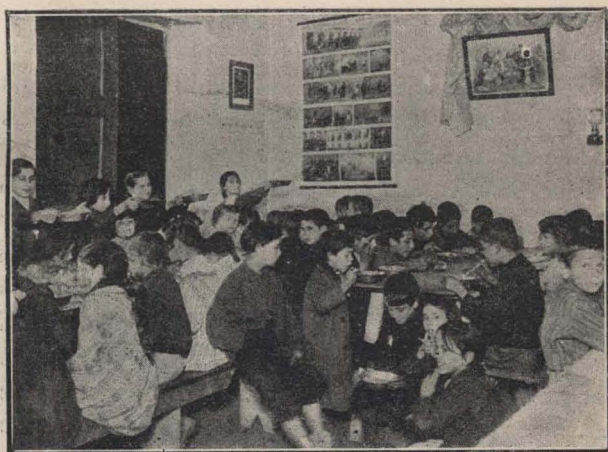
Asociación "La Obra de la Patria".

El subscripto ignora si en algunas de las instituciones privadas que dirigen y costean escuelas se proporciona meriendas a los niños externos; sólo sabe de las Escuelas Patrias, que a su proposición fundó el Patronato de la Infancia en el Parque de los