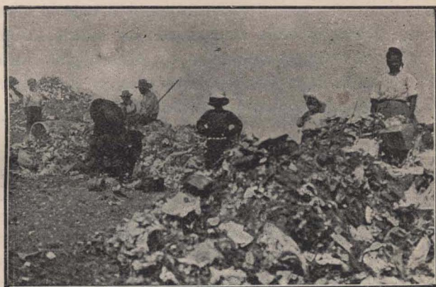
Niños alimentándose con basuras. — S. O. de la Capital.