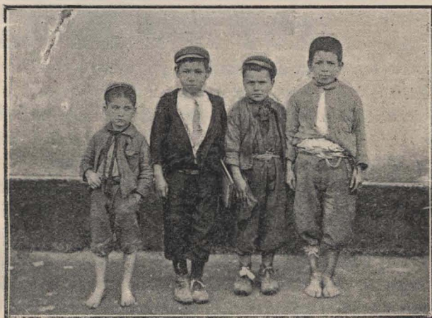
Niños menesterosos del S. O. de la Capital.

dos y distribuidos bajo la dirección de maestras especiales que reunan a su competencia, exquisita cultura y sentimientos maternales. Esa escuela debe ser el refugio más feliz del niño desheredado.