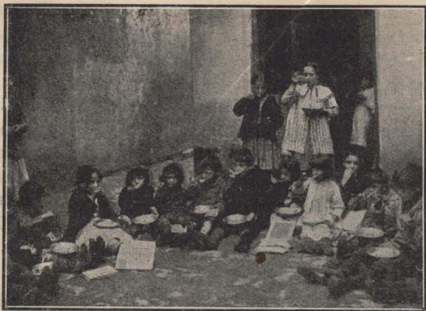
Asociación "La Obra de la Patria".

Los señores vocales han tenido ocasión de ver en otro de los centros en que hace sus experiencias sociales el subscripto, cómo recuperan lo perdido por la miseria más de doscientas criaturas que aguardan allí la edad escolar o la hora de concurrir, ya alimentadas, a las escuelas del vecindario; y ante ese espectáculo tan triste como augural de fructuosas reacciones, han de haber extrañado que quien propuso la inclusión en el presupuesto vigente de la partida para la alimentación de los niños menesterosos concurrentes a las escuelas primarias, no haya presentado aún el proyecto necesario para su aplicación y el subscripto debe explicarse.