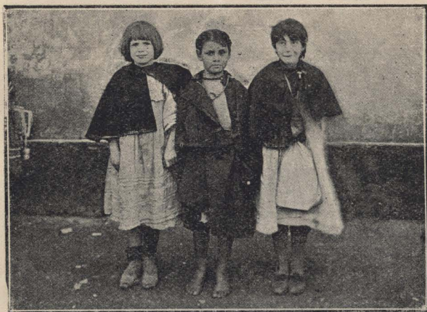
Niñas menesterosas del S. O. de la Capital.

rir el triste convencimiento de que la miseria fisiológica en los niños es mucho más común de lo que se cree generalmente. Muchas veces el subscripto ha sufrido en algunas aulas, ante la escua-