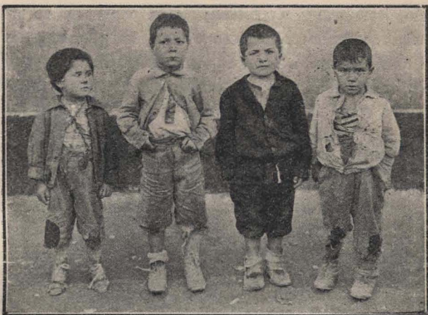
Niños menesterosos del S. O. de la Capital.

este número debe duplicarse si se cuentan los niños imposibilitados por esa miseria de concurrir a la escuela. Es en esta clase de escuelas donde debe iniciarse la provisión de alimentos, prepara-