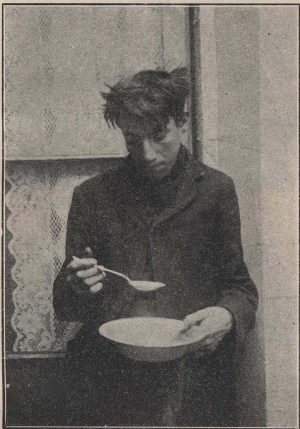
Adolescente menesteroso. «La Obra de la Patria».

H. Consejo podrá elegir entre las aspirantes aprobadas, el número necesario de maestras especiales que deberán tener a su cargo la dirección de las cocinas-cantinas, en las que las alumnas, al practicar esa clase de enseñanza, prestarán ayuda al niño menesteroso.