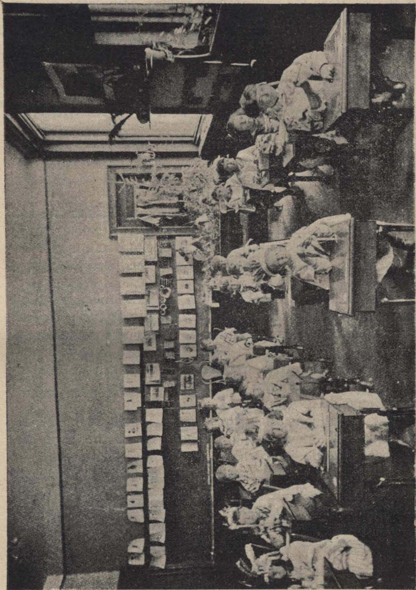
PRIMER GRADO — VIDA INDIA