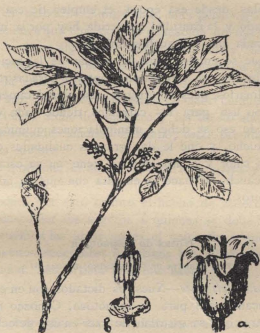
ÁRBOL DEL CAUCHO Ó GOMA ELÁSTICA a, Flor — b, Pistilo

En este estado es como se remite al extranjero.