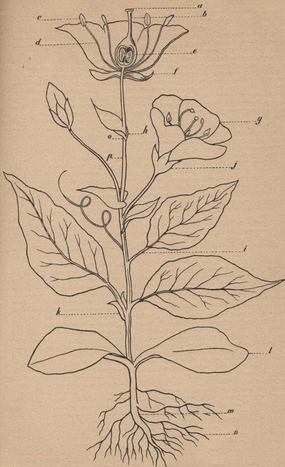
Diagrama de una planta completa

a, estigma. b, estilo. c, antera. d, filamento. e, óvulo. f, sépalo. g, corola de cinco pétalos.