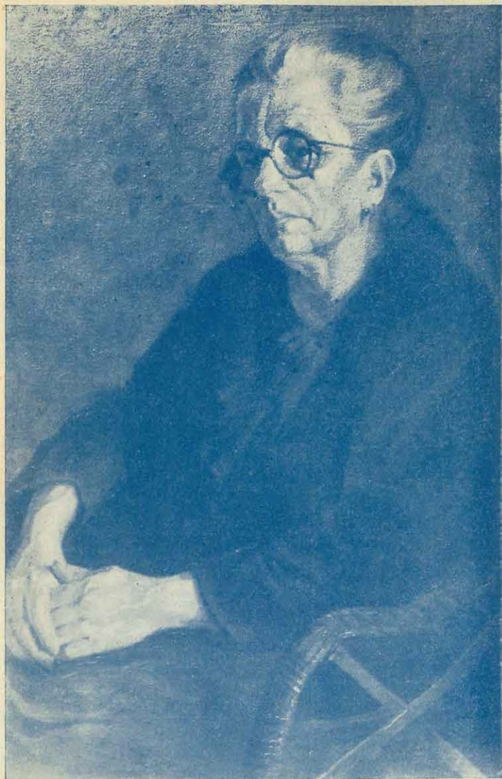
Cuadro del pintor Segundo Pérez que formará parte de la Galería de Arte que se creará en Dolores (Buenos Aires) en la Escuela Normal Mixta, con motivo del cincuentenario de ese establecimiento educacional