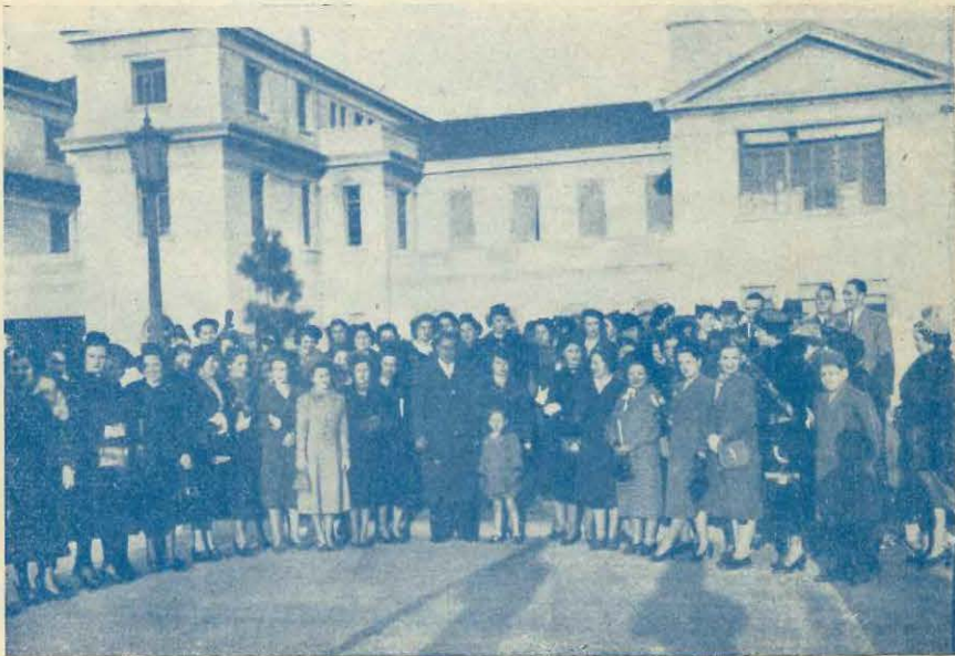
Socios del centro de Alumnos que concurrieron a la formación de la tarde en el Regimiento 1.º de Infantería