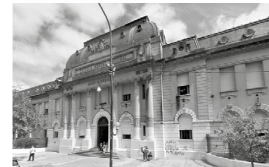
Unidad Académica Escuela Normal Superior N.º 1 Mary O. Graham