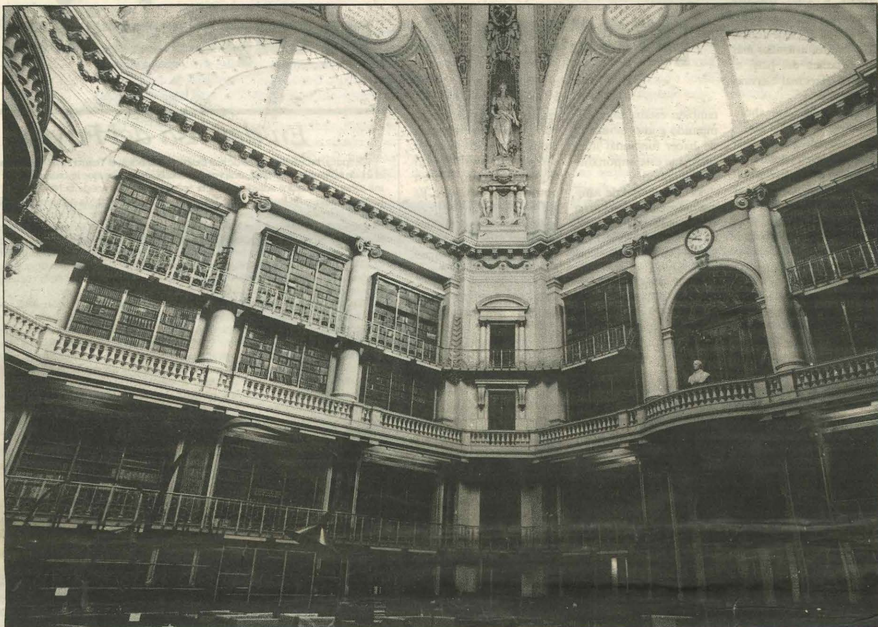
El deslumbrante edificio de la vieja Biblioteca Nacional cobijará al Centro Nacional de Música, uno de los grandes emprendimientos encarados por la Secretaría de Cultura. Es el futuro cercano