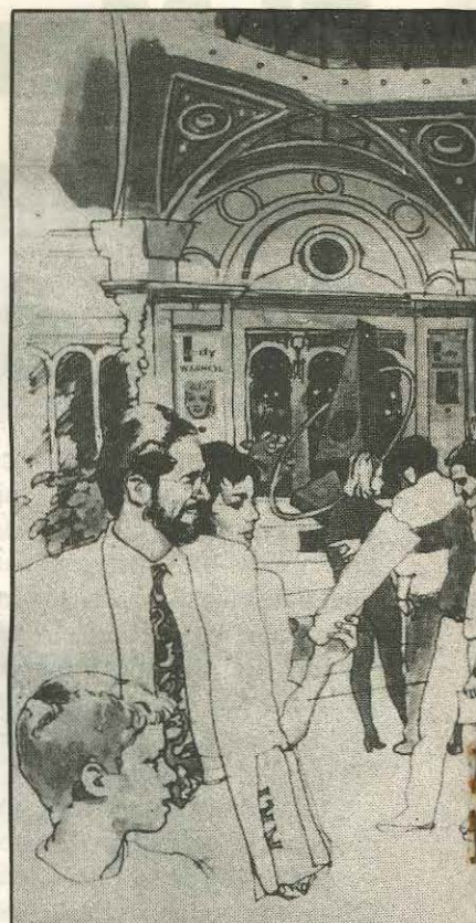
Una proyección hacia el futuro cercano.

A partir de este diagnóstico, el CEA y la embajada de los Estados Unidos invitaron al país al profesional norteamericano Alan Stein—quien posee una maestría en Bibliotecología y Ciencias de la Información— para que asesore a un grupo de planeamiento integrado por seis profesionales de alto nivel, cuya misión es elaborar un "masterplan" que permita colocar la Biblioteca Nacional de la Argentina en el nivel tecnológico de las mejores de Latinoamérica. Actualmente se está avanzando en los estudios para equipamiento necesario que permita el acceso a la información bibliotecológica de la manera más rápida y más simple posibles.