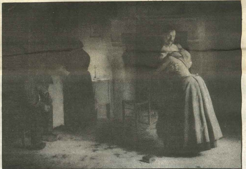
Antes y después de un trabajo de restauración en el Museo Nacional de Bellas Artes: "La vuelta al hogar", de Graciano Mendilaharsu