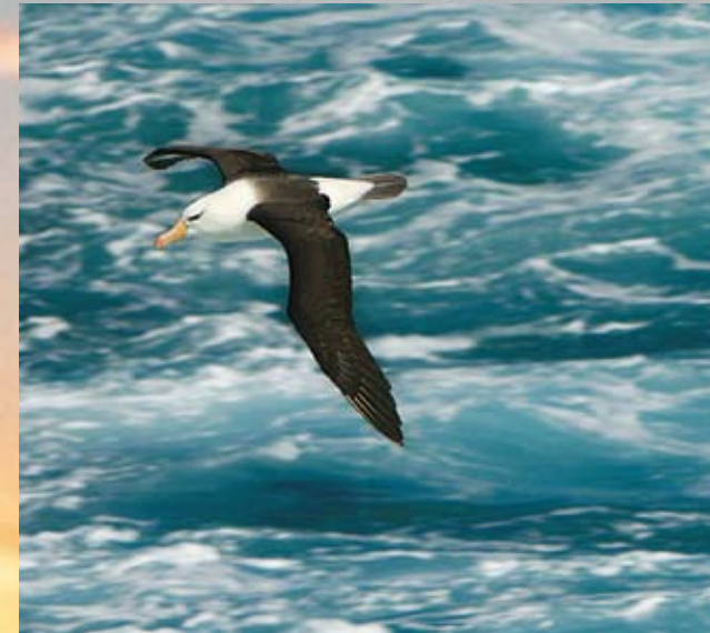
El albatros del Mar Patagónico puede recorrer casi mil kilómetros en un día