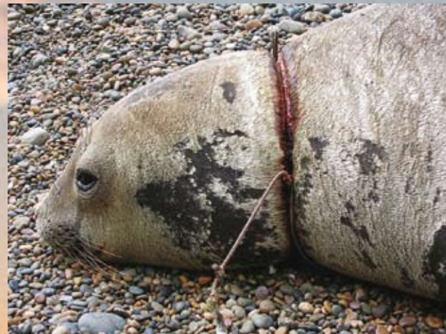
Animales atrapados en las redes de pesca. Una escena vergonzante.

que los atraen). Desde el cielo, en un vuelo nocturno se pueden apreciar las concentraciones de pesqueros que se ven como verdaderas ciudades en medio del océano.