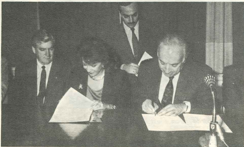
El Prof. Antonio Salonia y la Ing. María J. Alsogaray firman el convenio

Se firmó un convenio entre el Ministerio de Cultura y Educación y la Secretaría de Recursos Naturales y Medio Ambiente Humano que fue refrendado por sus titulares, Antonio Salonia y María Julia Alsogaray en un acto llevado a cabo en el Salón Rosario Peñaloza del Palacio Sarmiento.