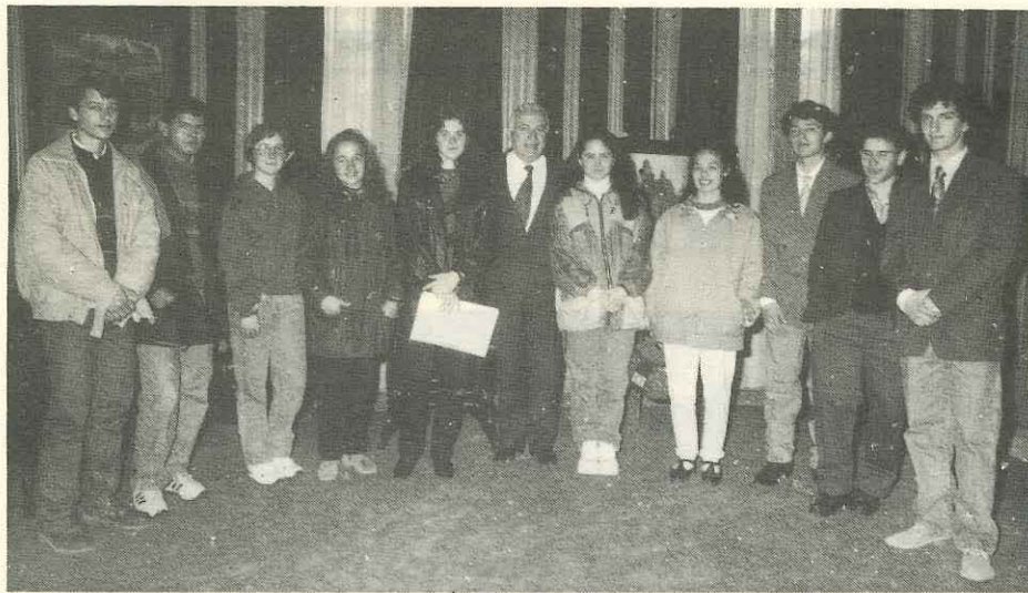
Los 10 becarios con mejores promedios en literatura e historia se reunieron con el Ministro Salonia