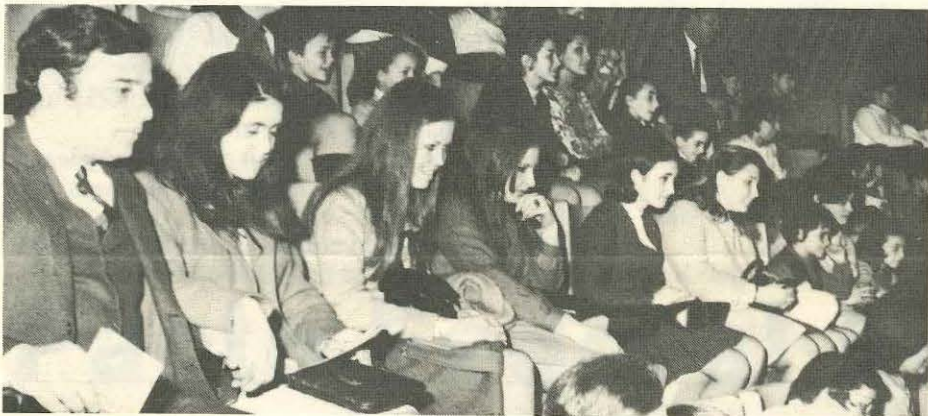
Una obra teatral concentró la atención de gran cantidad de jóvenes, como parte del programa de clubes colegiales

En las recomendaciones de la UNESCO se da prioridad fundamental, dentro del aspecto global de la prevención sísmica, a los programas de educación, especialmente en el nivel primario. De acuerdo a estas pautas, el Instituto Nacional de Prevención Sísmica (INPRES) y el Ministerio de Educación de la provincia de San Juan firmaron un convenio para efectivizar un programa de acción.