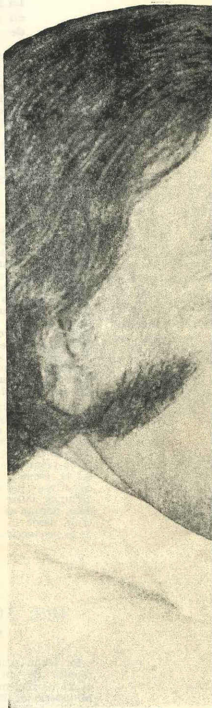
El Presidente Carlos Menem en un momento de su discurso a los maestros y alumnos.

Asimismo quiero anunciarles, en este acto, otra trascendente decisión del Gobierno Nacional. El envío al Congreso de la Nación del proyecto de Ley Federal de Educación que incluye las ideas y las propuestas fundamentales del Gobierno y también el aporte de múltiples sectores sociales y políticos del país, como así también, valiosas conclusiones