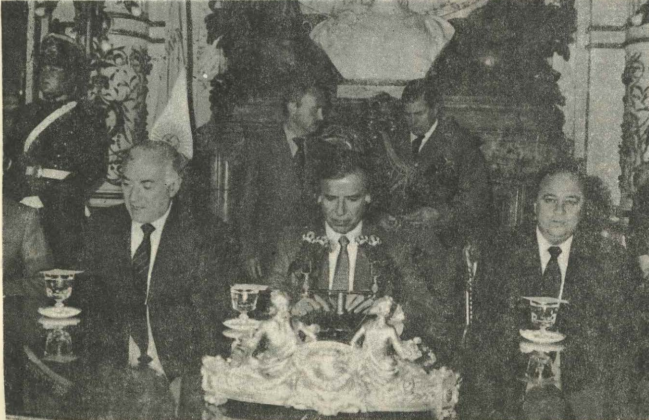
El Presidente de la Nación, Dr. Carlos Saúl Menem, preside el acto del 11 de septiembre junto al Ministro de Educación y Justicia Antonio F. Salonia y el Presidente de la Cámara de Diputados Alberto Pierri.