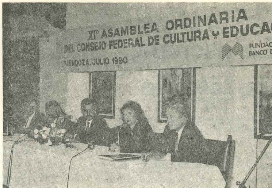
En la foto, las autoridades nacionales y provinciales que asistieron a las deliberaciones de la XI Asamblea del Consejo Fed. de Cultura y Educación.

D URANTE los días 5 y 6 de julio del corriente, en la ciudad de Mendoza, se llevó a cabo la XI Asamblea Ordinaria del Consejo Federal de Cultura y Educación.