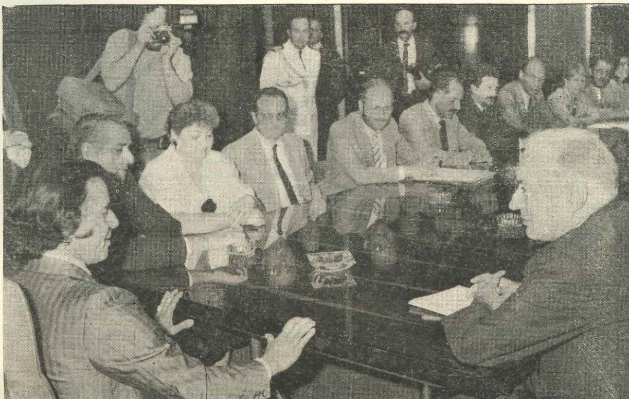
El presidente de la Nación, doctor Carlos Saúl Menem, recibe a los integrantes del Consejo Federal, en una audiencia donde se abordó la situación educativa del país.