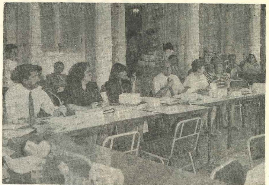
Vista parcial de autoridades provinciales asistentes a la VI Asamblea del Consejo Federal de Cultura y Educación

Se reunió en la Capital Federal y analizó temas de candente actualidad educativa