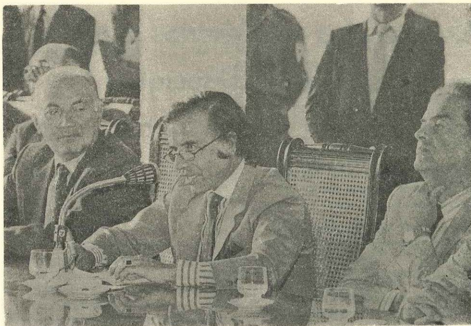
Durante el acto de constitución del Consejo Consultivo, el Presidente de la Nación, doctor Carlos Menem, acompañado por los ministros de Trabajo y Seguridad Social, Jorge Triaca y por el de Educación y Justicia, Antonio Salonia.

El doctor Carlos Menem comenzó su mensaje diciendo: “El Presidente de todos los argentinos, no viene hoy a hablarles del país en crisis, de los problemas coyunturales, de las diarias dificultades que debemos atravesar en estos tiempos. Todos, absolutamente todos, conocemos a la perfección los dramas y las múltiples piedras que se cruzan en el camino, cuando llega la hora de remover obstáculos y avanzar hacia el porvenir. Por eso, hoy deseo hablar de las condiciones y de los requisitos indispensables, para alcanzar ese futuro tan anhelado.