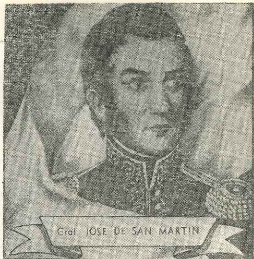
Gral. JOSE DE SAN MARTIN