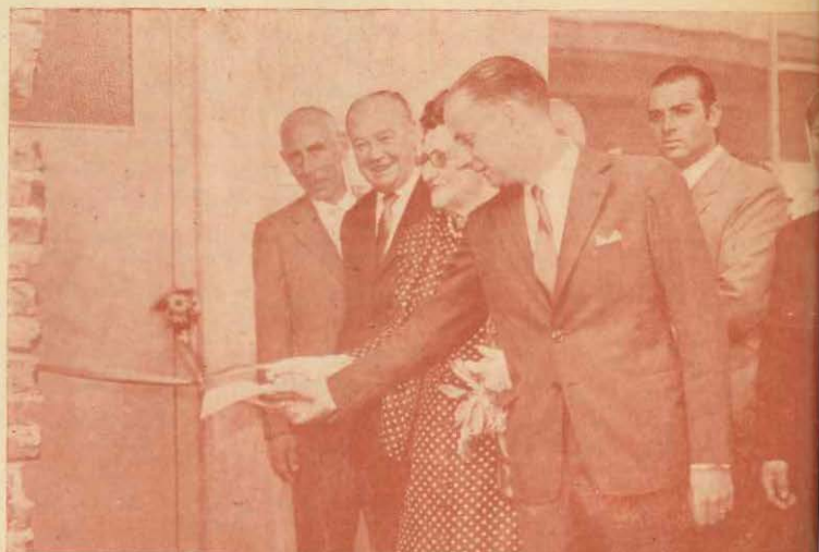
El Presidente del Consejo Nacional de Educación Técnica, Prof. Ernesto F. Babino, procede a la inauguración de las nuevas obras de la Escuela Industrial de Mar del Plata.

La Escuela Industrial de MAR DEL PLATA es un vivo ejemplo de lo que pueden la voluntad y el esfuerzo de la comunidad volcados en una obra que beneficia a todos.