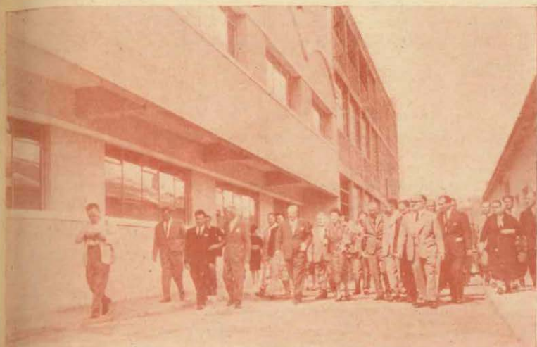
Las autoridades y público recorriendo las instalaciones de la escuela

y empresas de la zona, el CONSEJO NACIONAL DE EDUCACION TECNICA y los padres de familia; y