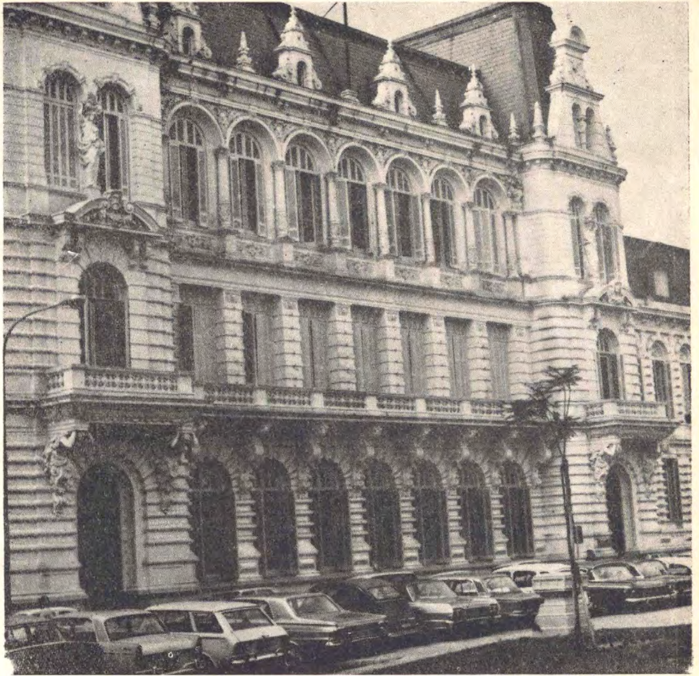
CONSEJO NACIONAL DE EDUCACION