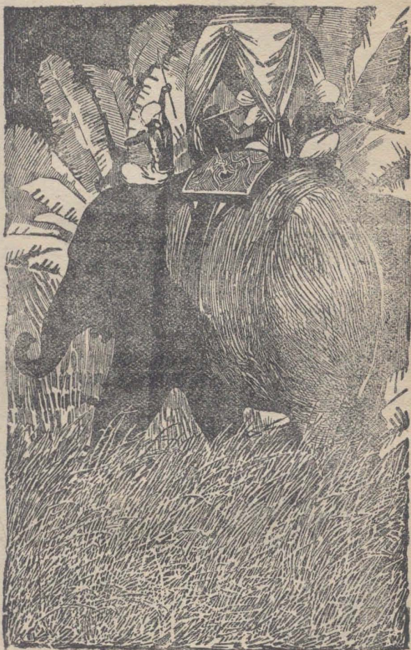
El bravo paquidermo corría a gran trote... (Pág. 44.)