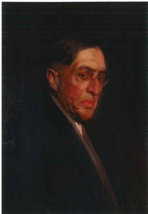
Retrato de Fernando Fader, 1940, Antonio Alice. Óleo s/tela, 67 x 48 cm.

Reúne obras de mediados del siglo XIX y mediados del XX. Representan actividades de la vida cotidiana, paisajes, acontecimientos históricos, naturalezas muertas y retratos, influenciadas por movimientos artísticos tales como el realismo e impresionismo.