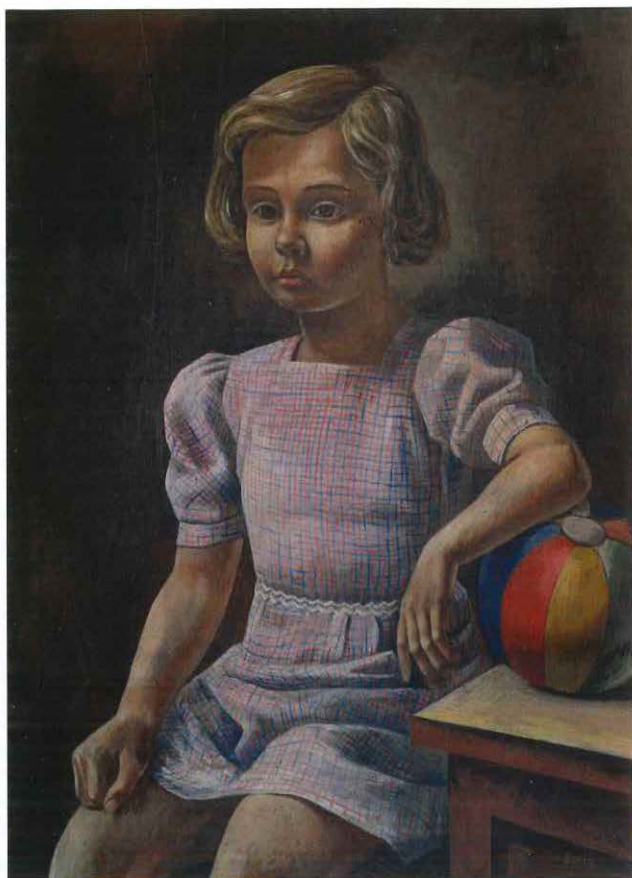
La niña del balón, 1937, Antonio Berni. Temple s/madera, 88 x 70 cm.

La Secretaría de Educación de la Nación cuenta con un acervo patrimonial que reúne 400 obras de artistas argentinos elaboradas en diferentes épocas.