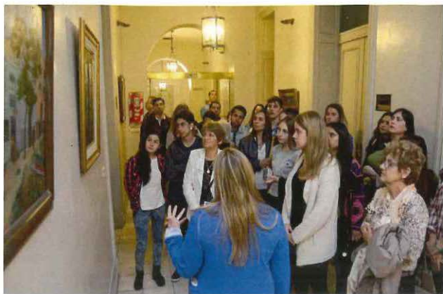
Visita para el público general durante el evento La Noche de los Museos.