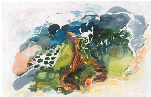
Monte y camino, 2016, Ignacio de Lucca. Óleo s/tela, 89 x 140 cm.

Compuesto por obras realizadas desde los años 80 hasta la actualidad, con distintas técnicas y materiales. Ilustra y recorre la trayectoria del arte argentino de nuestro tiempo.