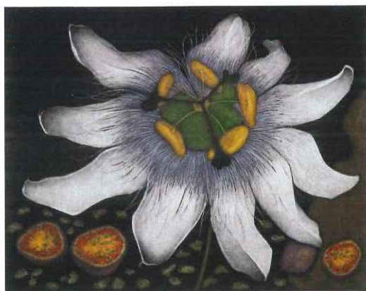
Mburucuyá. Fruto de la pasión, 1997, Alicia Scavino. Aguatinta, 13/50, 49 x 64 cm.

Se compone de obras realizadas con la técnica de grabado o estampa. Este conjunto de obras forma parte de la colección gracias a la donación de la Academia Nacional de Bellas Artes.