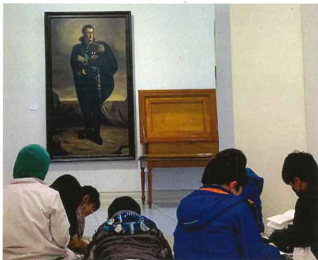
Alumnos de primaria participando de la visita a la Pinacoteca.

La Pinacoteca y el Palacio Sarmiento se pueden conocer en las visitas guiadas para el público general. También, se realizan recorridos didácticos para la comunidad educativa en todos sus niveles, en el marco del programa “El Ojo Escolar”.