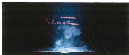
Firma del pintor.