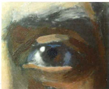
Detalle del ojo derecho. Retrato de Domingo Faustino Sarmiento.