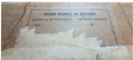
Etiqueta de la oficina.