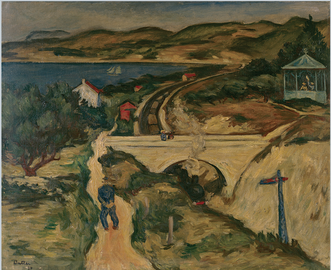
Horacio Butler - El paseo del jefe óleo sobre tela - 1930.

Se introducirá el Núcleo Histórico de la Colección, haciendo foco en la diferencia entre la pintura y el dibujo, la presencia de los diferentes géneros, el lugar ocupado por la figura humana en la obra, etc.