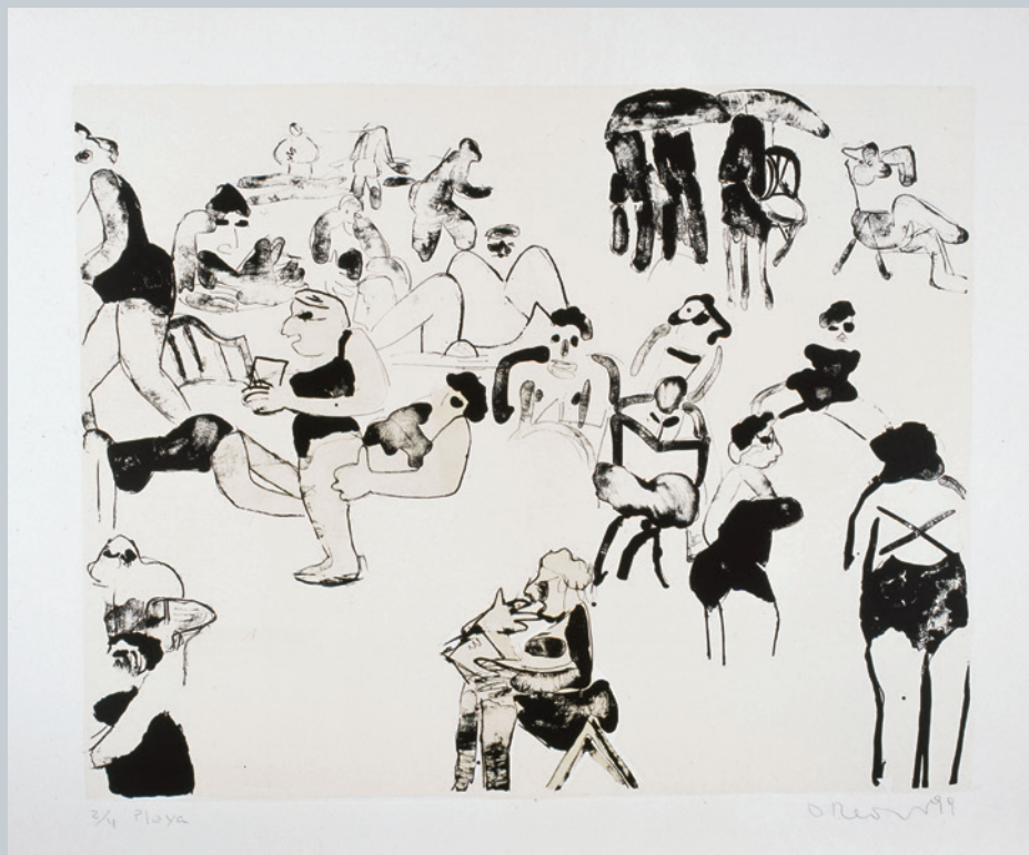
Lucrecia Orloff - La playa Litografía - 1999.

Analizamos las diferencias entre la figura humana vista hasta el momento y los cuadros modernos, prestando atención a los colores, las líneas y a la relación figura-fondo