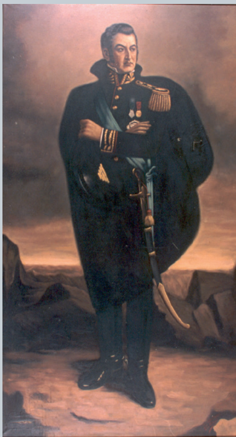
José Aldioli - Retrato de San Martín óleo sobre tela - sin fecha.

Nos enfocamos en el personaje de la obra y también en la relación figura-fondo, para analizar porqué es importante el contexto del retrato para entender mejor a ese personaje.