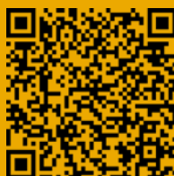
Versiones en lenguas indígenas