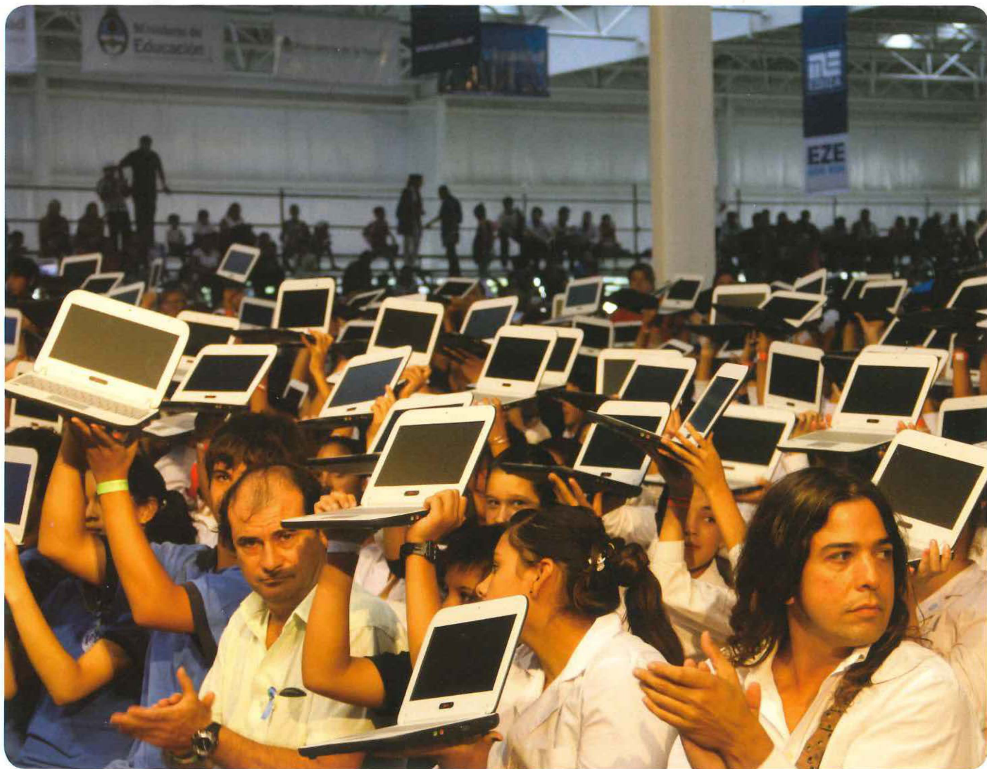
Los alumnos de Ezeiza recibieron 14.000 netbooks del Programa Conectar Igualdad.

1.640.489 | son los alumnos que ya cuentan con su netbook.