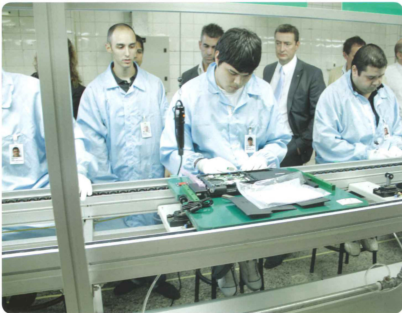
En las plantas de la fábrica BGH, ubicadas en Tierra del Fuego, se ensamblan componentes de las netbooks de Conectar Igualdad.

100% | de equipos con valor agregado nacional es lo que prevé el último llamado a licitación 2011.