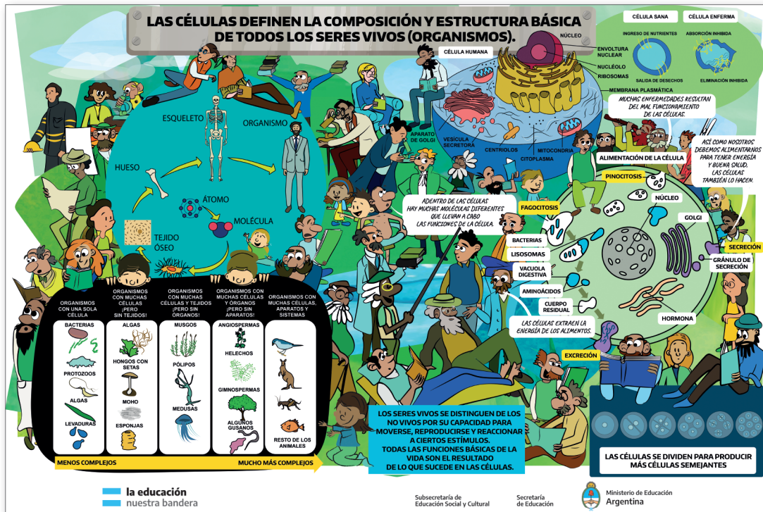
LÁMINA 10: Los organismos precisan y requieren un debido abastecimiento de energía y de materiales de los cuales con frecuencia dependen y por los que compiten con otros organismos

Todos los seres vivos necesitan energía para nutrirse, así como aire, agua y ciertas condiciones de temperatura.