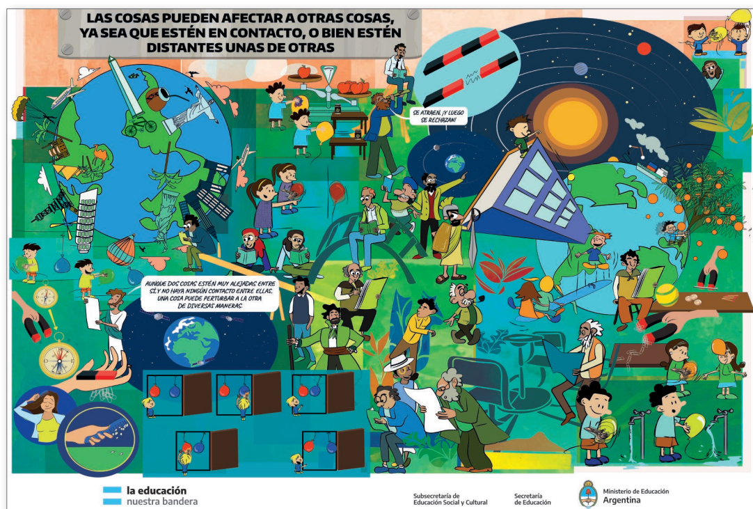
LÁMINA 3: Para que se produzca un cambio en el movimiento de un cuerpo, debe operar sobre ese cuerpo una fuerza neta, externa a él

NOTA: Por cambio en el movimiento entendemos una variación en su dirección y/o en su rapidez y/o en su sentido.