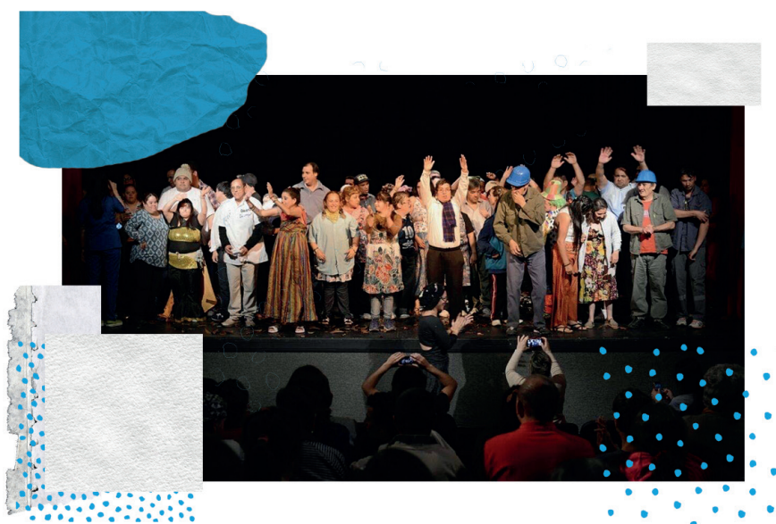
Taller de teatro para personas con discapacidades en la sala Teatro Leopoldo Marechal de Moreno.

Nunca olvidar que estamos jugando. ¡Viva el teatro!