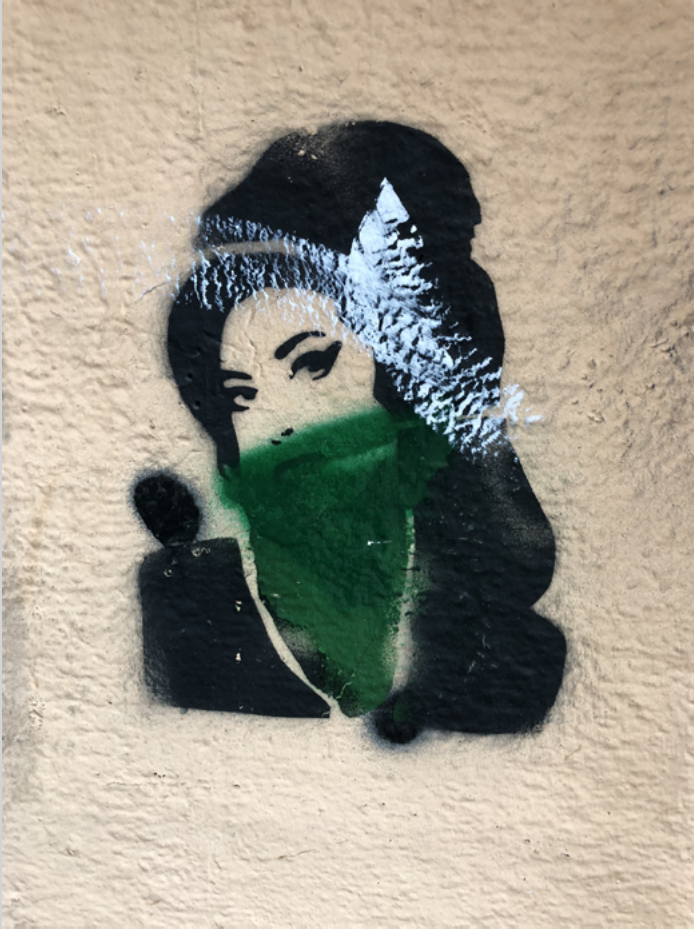
Grafiti de Amy Winehouse pintado en las calles de Buenos Aires durante las movilizaciones por la despenalización del aborto (2018).