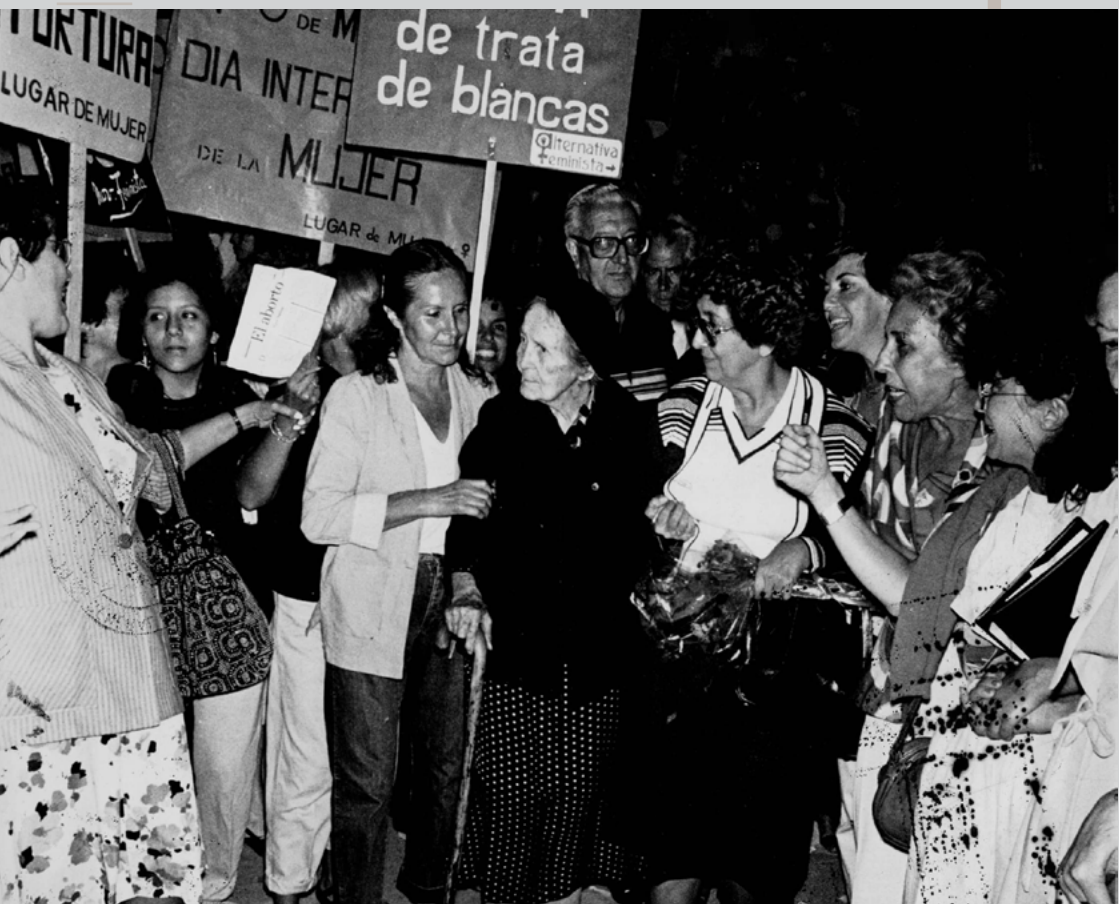
La doctora Alicia Moreau de Justo y diversas agrupaciones feministas se manifiestan en las calles contra la violencia a las mujeres en marzo de 1984.