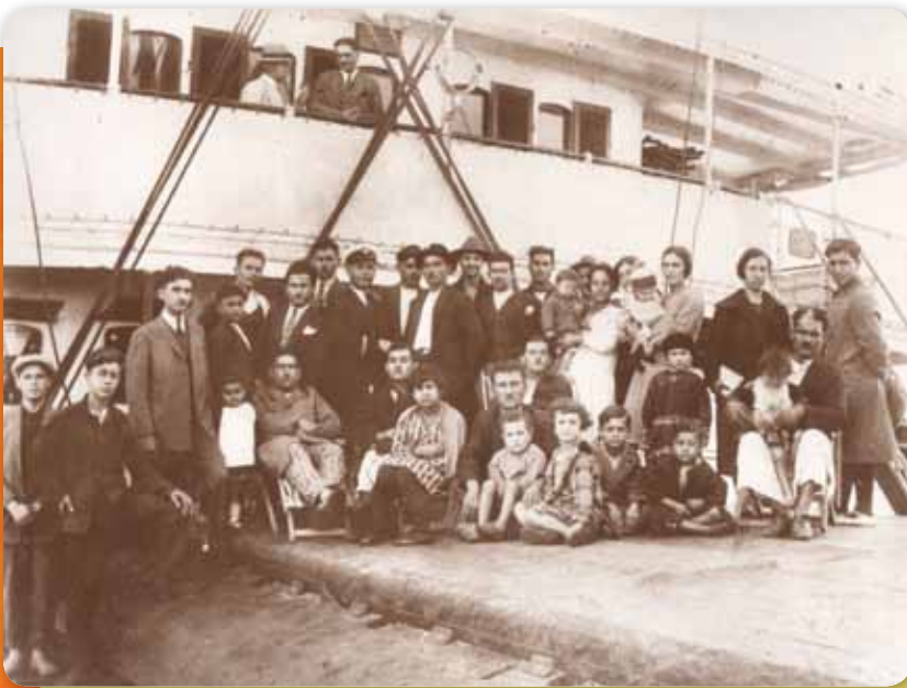
Museo Nacional de la Inmigración

En los últimos ciento cincuenta años, llegaron a la Argentina personas de diferentes países. En la actualidad, los inmigrantes provienen en un gran porcentaje de América Latina, de Asia y de África. Las leyes argentinas reconocen su derecho a vivir y trabajar aquí, en igualdad de condiciones.