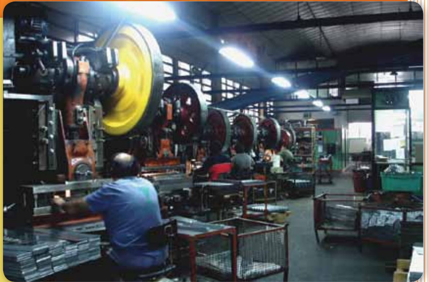
Movimiento Nacional de Fabricas Recuperadas.

Tras la quiebra de muchas empresas, los trabajadores se organizaron para volver a ponerlas en funcionamiento. El Estado ha reconocido a estas empresas sociales, las apoya y colabora para que salgan adelante.