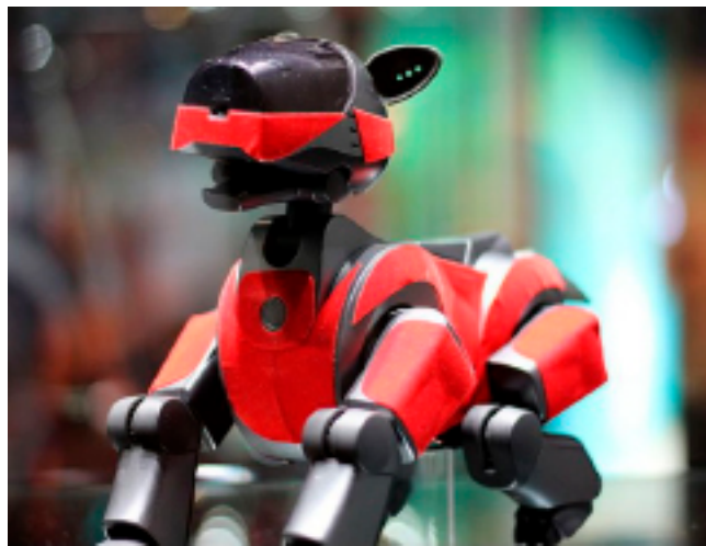
Un ejemplo de mascota robot.