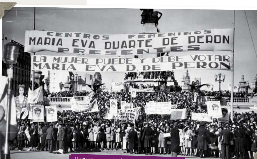
MUJERES FRENTE AL CONGRESO CELEBRANDO LA SANCIÓN DE LA LEY DEL VOTO FEMENINO.