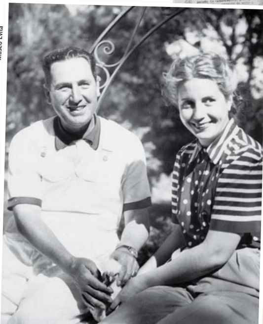
EL MATRIMONIO EN LA QUINTA DE LA LOCALIDAD DE SAN VICENTE, LUEGO LLAMADA "17 DE OCTUBRE".