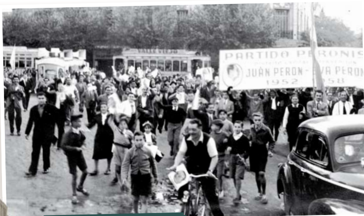
MANIFESTACIÓN A FAVOR DE LA FÓRMULA JUAN PERÓN-EVA PERÓN.

HOMBRES Y MUJERES SE CONGREGABAN ENTUSIASTAS PARA ESCUCHAR A PERÓN Y EVITA.