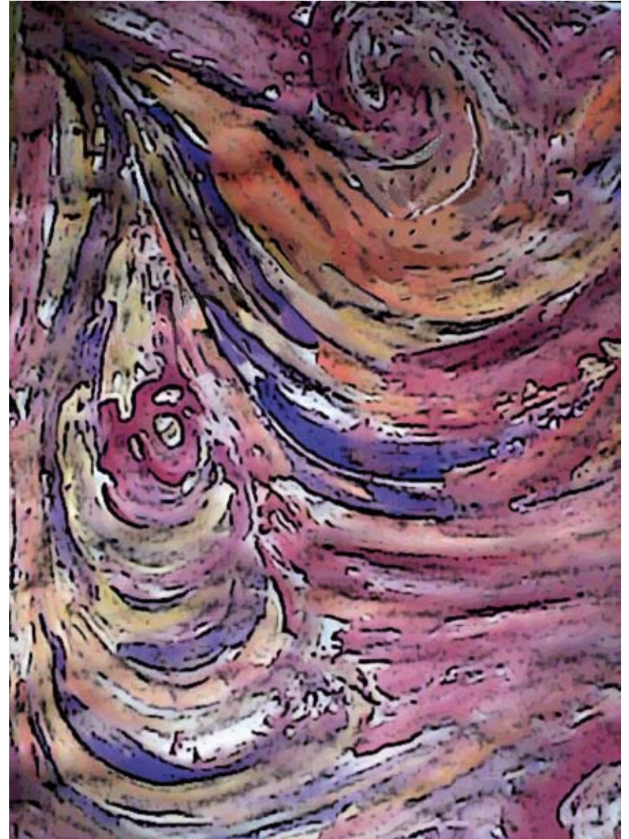
"Lavarropas de ideas"