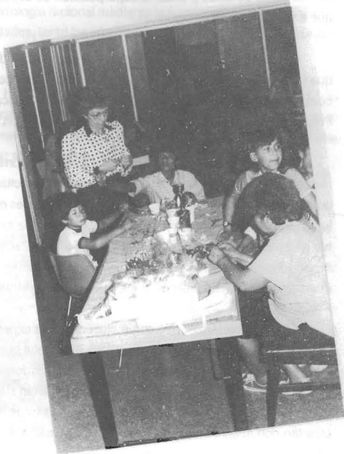
Taller de Artesanías y Manualidades

El sistema está apoyado en una infinita cuota de afecto que no implica permisividad sino responsabilidad, respeto mutuo, compañerismo, cooperación, etc.-