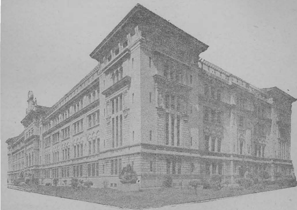
Edificio del Instituto "Félix Fernando Bernasconi"