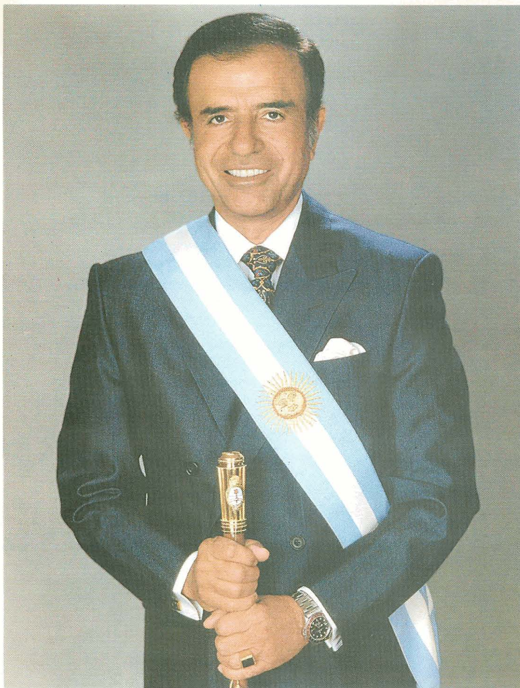
Dr. Carlos Saúl Menem