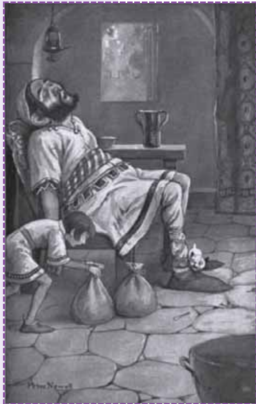
Ilustración de Newell, Peter. Favorite Fairy Tales: The Childhood Choice of Representative Men and Women . New York: Harper & Brothers, 1907.

¡Hay, dichosa de mí, que hijo tan listo tengo!