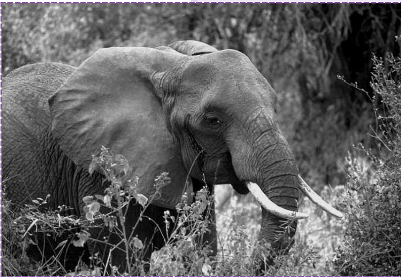
Imagen: Elefante Africano. Stolz, M. En Wikimedia

Tienen una única cría, que se desarrolla durante 22 meses dentro del cuerpo materno. Son mamíferos. Al nacer pesan alrededor de 115 kilogramos.