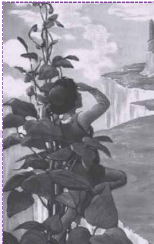
Ilustración de Jessie Willcox Smith. 1916. Swift's Premium Calendar.