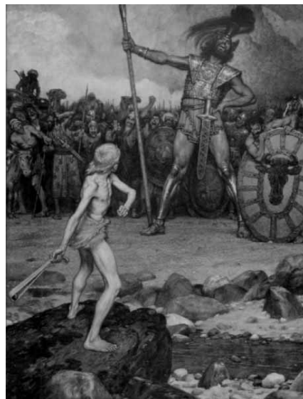
Imagen: Osmar Schindler, David und Goliath. Wikimedia Commons.